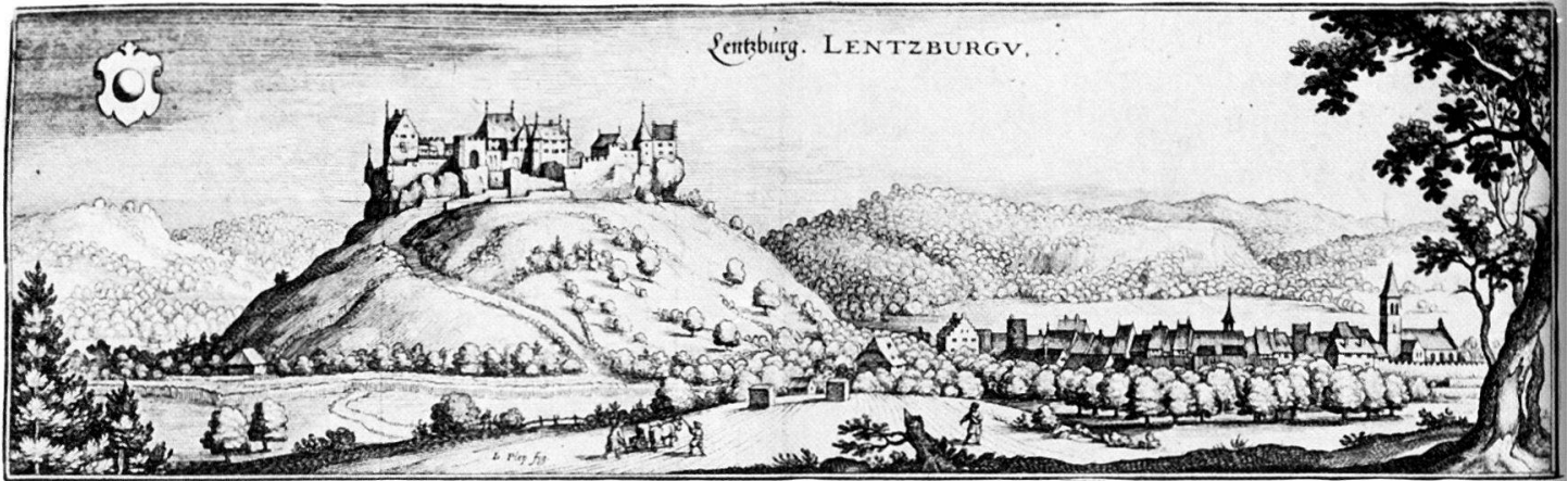
Abbildung 6 A: Matthäus Merian, Ansicht von Stadt und Schloß Lenzburg, Kupferstich, Frankfurt am Main 1642