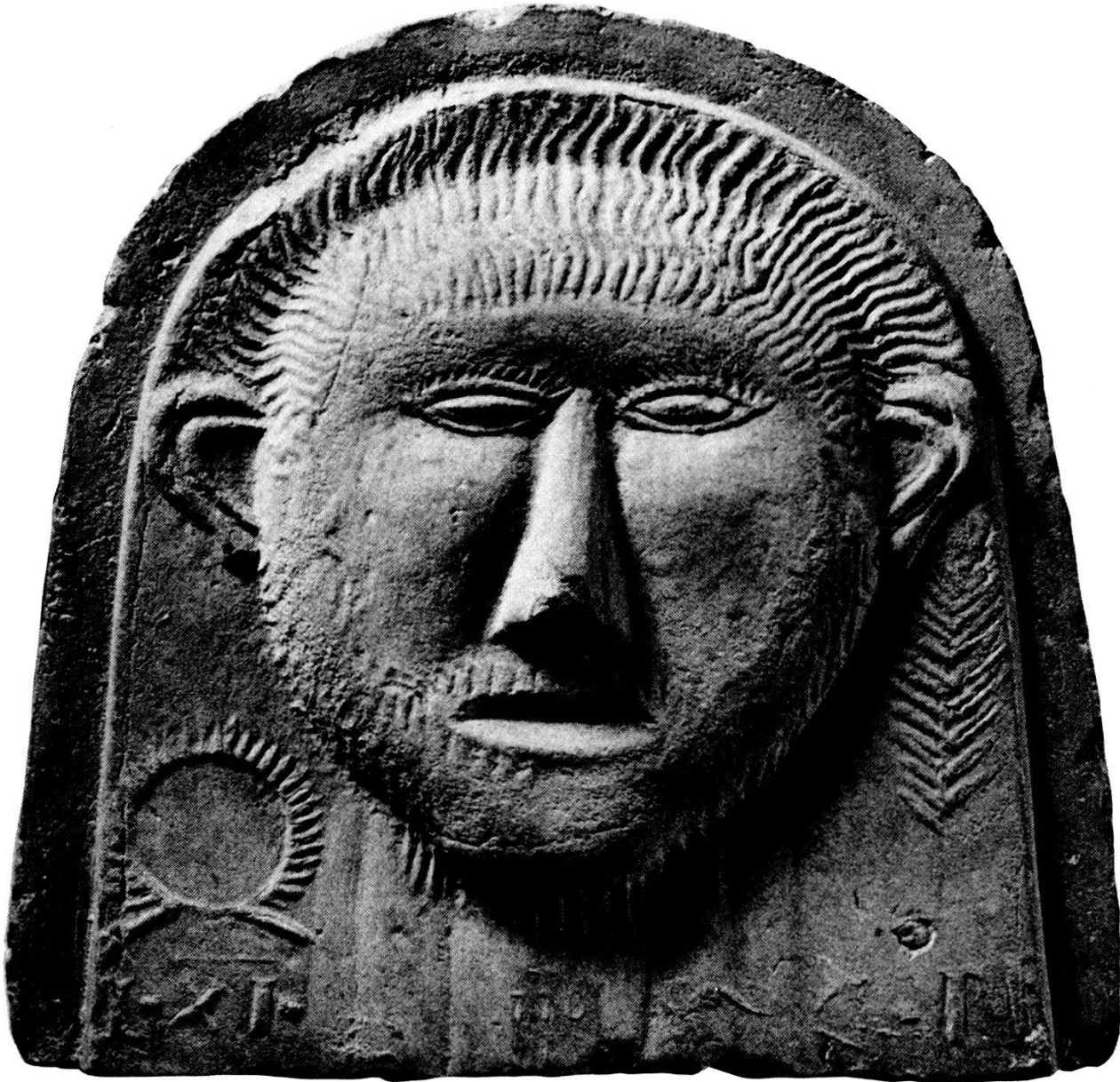
Stirnziegel mit Darstellung eines Gallierkopfes, Abbildung aus «Die Römer im Aargau»