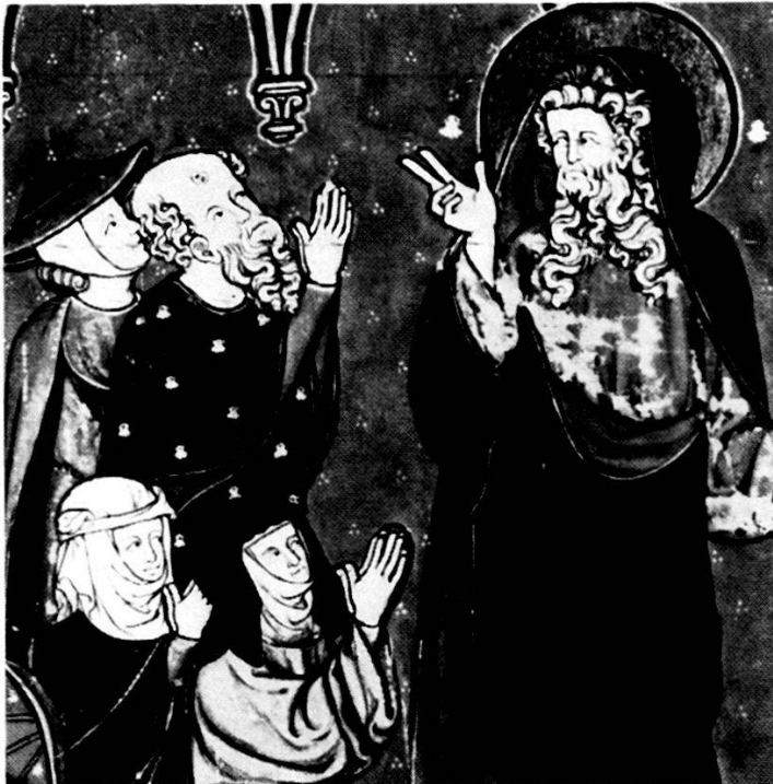
Bibliothèque Nationale Paris. Ms. nouv. acq. fr. 16251, fol. 20v.