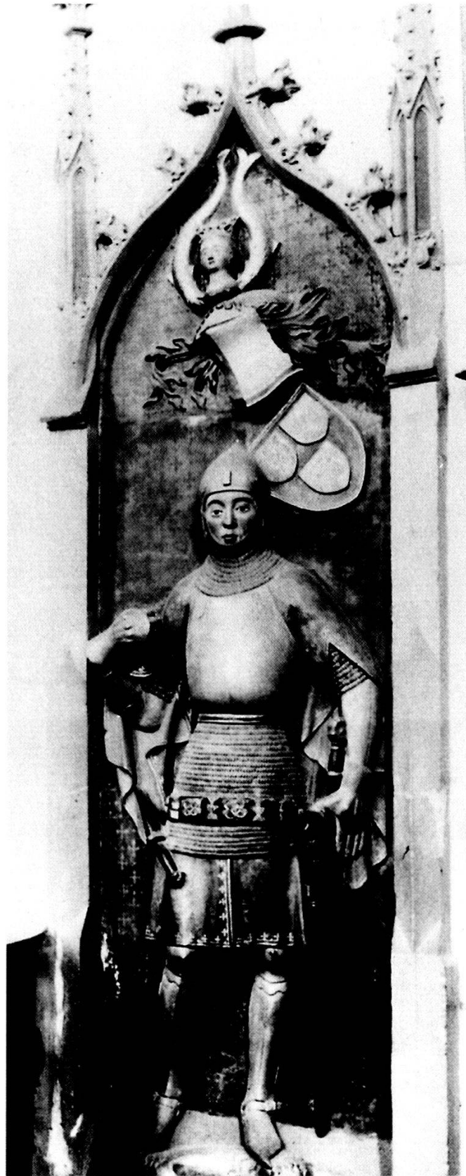
Abb. 2: Bad Wimpfen (Lkr. Heilbronn, kath. Pfarrkirche [ehemals Dominikanerkirche]: Grabdenkmal Engelhards VIII. v. Weinsberg (gest. 1417 X 1)