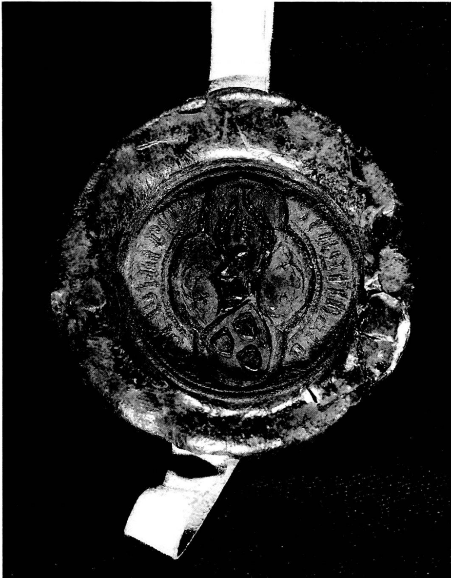
Abb. 3: Siegel des Engelhard VIII. v. Weinsberg aus der Amtszeit als österr. Landvogt (hier nach STA Aarau, Urk. Königsfelden Nr. 429: 1394 April 29)

Dienstgelder bis auf 2 000 Gulden quittierte: Von einer vorangegangenen Abrechnung über Einnahmen und Ausgaben des Landvogtes, wie sie sonst spätestens am Ende der Amtszeit eines Landvogtes üblich war, ist hier erstaunlicherweise nicht die Rede. Ebenso wenig ist bekannt, ob und wann Engelhard sein restliches Dienstgeld erhalten hat. Doch steht fest, daß Engelhard VIII. v. Weinsberg bei den österreichischen Herzögen ein zweites Guthaben besaß: Bis auf ausstehende 1 500 Gulden quittierte er ihnen nämlich in derselben Urkunde die Rückzahlung von 10 000 Gulden, die sie ihm schuldig waren.