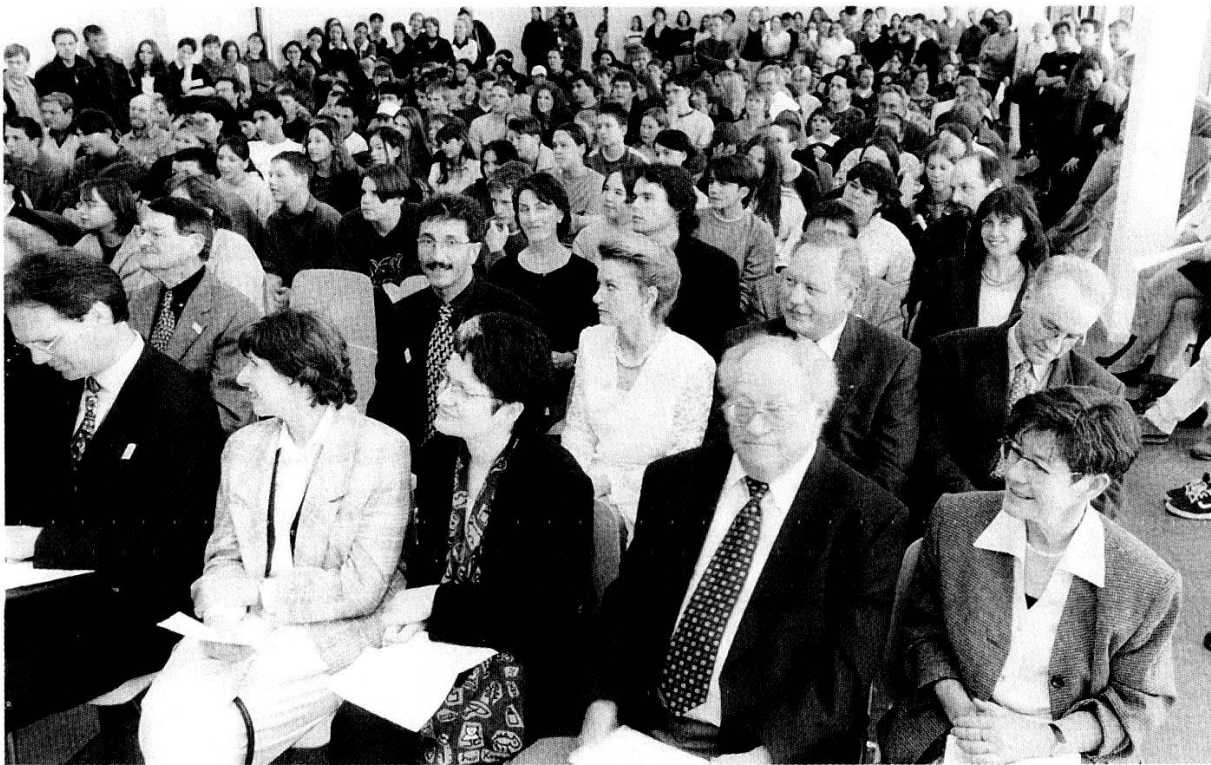
Abb. 2: Preisverleihung, Publikum im Saal des Lehrerbildungszentrums in Aarau.