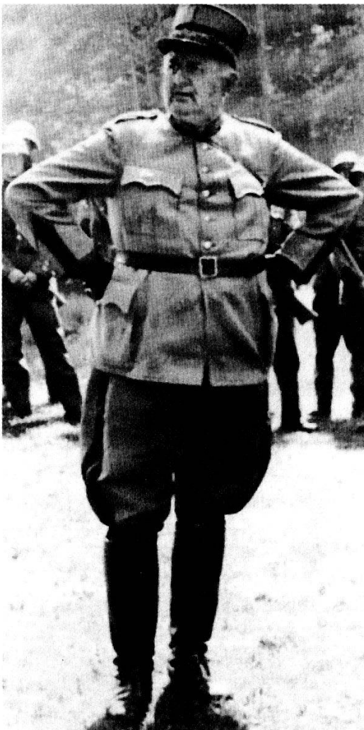
Abb. 3: Eugen Bircher

(Leider war es mir nicht möglich, irgendwelche konkretere Beispiele von faschistischen Übergriffen im Aargau während des Zweiten Weltkriegs zu finden. Die Informationen oder Zahlen darüber konnte ich in keinem Buch oder in einer anderen Informationsquelle finden. Doch ich denke, nur dieses Beispiel zeigt die durchaus vorhandene Bereitschaft zur Kooperation mit dem faschistischen Deutschland von einigen Gruppierungen und Personen im Aargau ziemlich gut.)