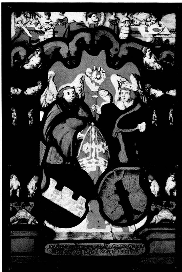
Wappenscheibe aus dem Kloster Muri von 1551.

im Rahmen eines gesamtschweizerischen Forschungsprojektes mithilfe von Computertomografie und Röntgenstrahlen untersucht werden. Die Medienberichterstattung verschaffte der Kulturgutpflege grosse Publizität.