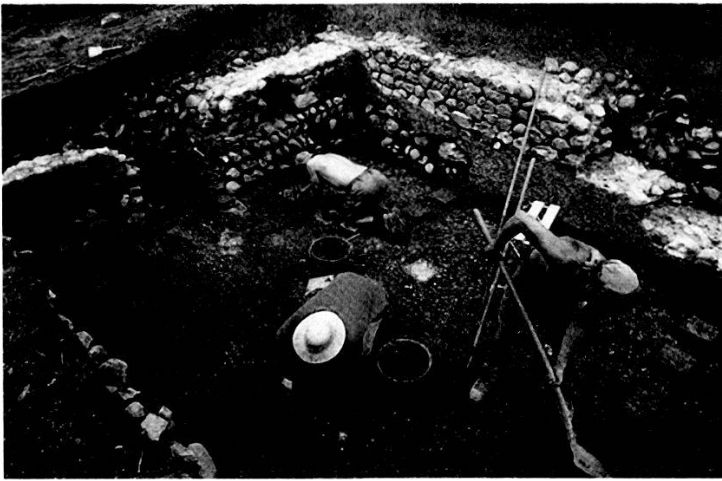
Mitarbeiter der Kantonsarchäologie beim Freilegen der gut erhaltenen Badeanlage in der römischen Villa von Möriken.

Die Bibliotheksbestände konnten auch dieses Jahr wieder durch den regulären Tauschverkehr sowie durch den Kauf von Büchern aus Mitteln des Kantons und der Gesellschaft Pro Vindonissa erweitert werden.