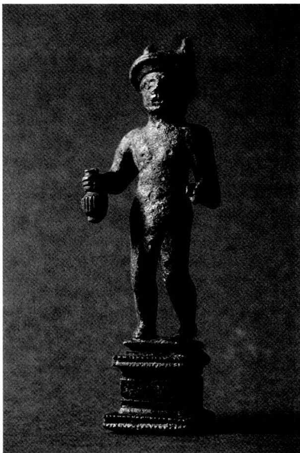
Eine acht Zentimeter grosse Bronzestatuetten des römischen Gottes Merkur von der Grabung in Zurzach «Uf Raine».

Das überfüllte Archiv wurde mit einer Kompaktusanlage ausgebaut, die insbesondere das Fassungsvermögen im Bereich Tagebücher und Fotos/Dias verdoppelt.