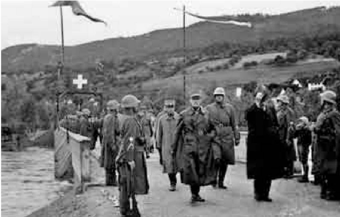
Besichtigung der neuen Brücke zwischen Biberstein und Rohr durch Prominenz aus Militär und Politik am Dienstag, 16. Juli 1940.

Rheinfelden weiter nordwestlich liegt und Biberstein deshalb wohl nicht als Etappenort für die dort Evakuierten infrage kam. Laufenburg besass 1941 1531 Einwohner. 46 Wenn von der Gesamtbevölkerung die Hälfte zurückgeblieben wäre, also die wehrhaften Männer und die Ordnungsmannschaften, hätte Biberstein trotzdem rund 750 Personen aufnehmen müssen, was die Bevölkerung Bibersteins, wenn auch nur für kurze Zeit, mehr als verdoppelt hätte. 47