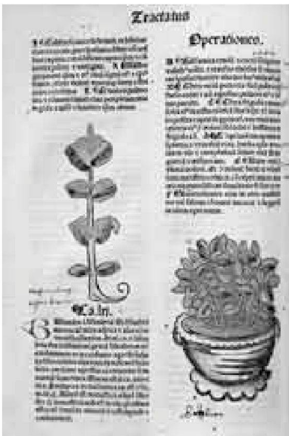
Handkolorierte Erstausgabe des Hortus Sanitatis (1491).