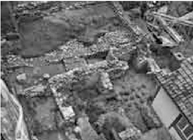
Ennetbaden-Grendelstrasse. Blick auf den nördlichen Teil des Grabungsareals mit den Resten einer Hypokaustheizung.

die vollständige Untersuchung der römischen Ruine. Das um die Mitte des 1. Jahrhunderts n. Chr. anstelle einer älteren Werkstatt, vermutlich einer Schmiede, erbaute Gebäude wurde wohl schon bald nach seiner Errichtung ein erstes Mal verlassen. Einige Zeit später wurden die instabilen Mauerfundamente verstärkt und es wurden mehrere Drainagen sowie drei Darren eingebaut. Bereits im 2. Jahrhundert n. Chr. wurde das Gebäude endgültig aufgegeben.