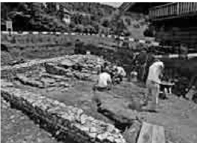
Ausgrabung Zeihen-Staufel. Freilegungsarbeiten im römischen Gebäude. Links die drei Darren.