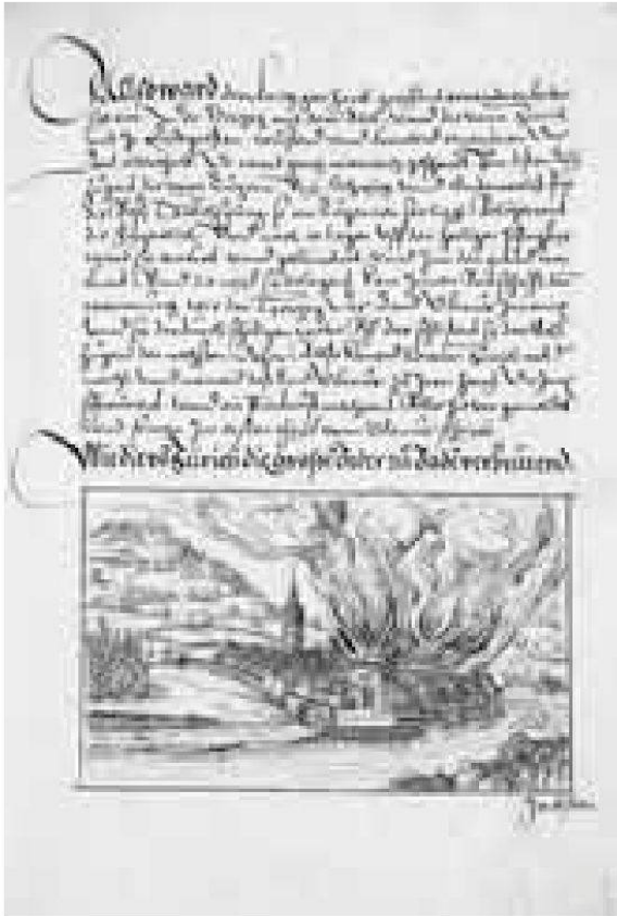
Brand der Stadt Baden. Erster Band der Chronik von Christoph Silberysen (1576), Illustration von Jakob Hoffman.