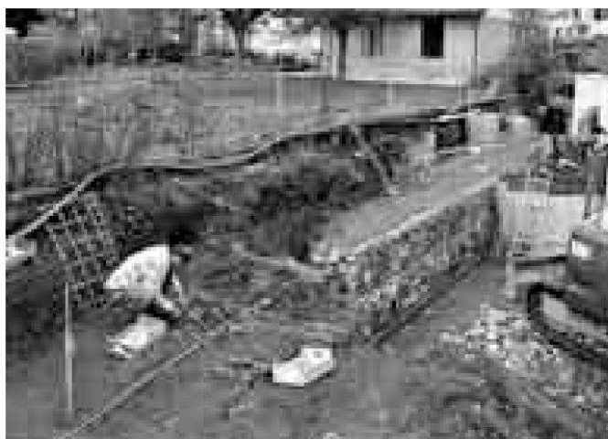
Lenzburg-Aarauerstrasse. Freilegen der Bestattungen.

Sondierungen und Vorabklärungen im Badener Bäderquartier: Auch im Jahr 2008 liefen die Grabungsvorbereitungen im Badener Bäderquartier weiter. Neben zahlreichen Begehungen und weiteren Archivrecherchen fanden im August/Sep-