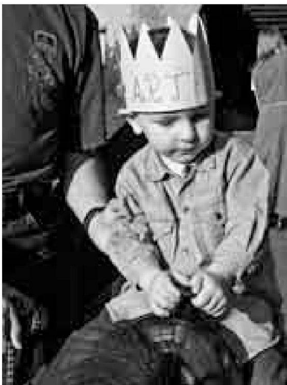
Kleiner Ritter übt sich im Reiten, Pfingstfest auf Camelot, Lenzburg 2008.

Dies will auch das Museum Aargau im Schloss Lenzburg: die Geschichte greifbar machen. In Zukunft können die Besucher beim Originalobjekt Informationen beziehen, Kreativität entwickeln oder mit der Besitzerin des Objekts ins Gespräch