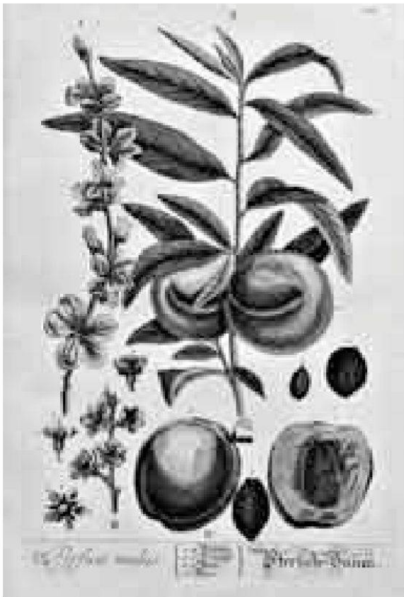
Aus der deutschen Ausgabe (1757–1773) des Herbariums der Elizabeth Blackwell.