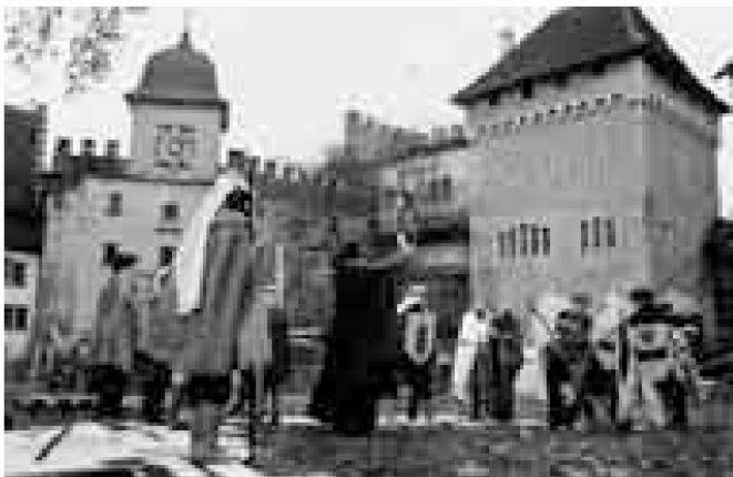
Als Ritter verkleidet erleben die Kinder ein mittelalterliches Turnier, 1976.

Die drei Testjahre hatten verschiedene Schwerpunkte. Da es in der Schweiz keine Museen mit etablierter Museumspädagogik in Form der «Living History» gab, musste alles neu erfunden werden. Das erste Jahr sollte klären, wie man Museums-