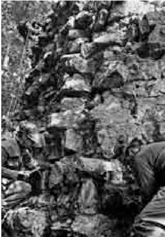
Burgruine Besserstein (Gemeinde Villigen). Dienstleistende der Zivilschutzorganisation Bözberg-Geissberg beim Reinigen des Turmsockels.