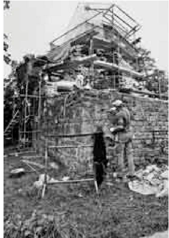
Burgruine Tegerfelden (Gemeinde Tegerfelden). Der eingerüstete Hauptturm während der Sanierungsarbeiten.