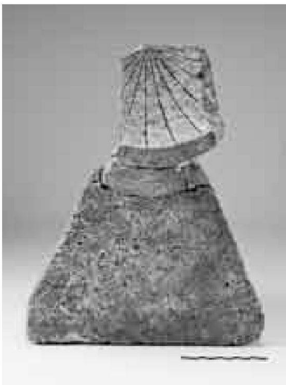
Ausgrabungen Vision Mitte. Römische Sonnenuhr.

Neben zwei kleineren Ausgrabungen in Zuzgen und Zeihen lag das Hauptaugenmerk im Kanton auf Grabungen in Baden und Ennetbaden sowie den Vorbereitungen zu den bevorstehenden Untersuchungen im Badener Bäderquartier.