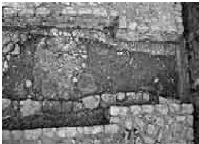
Legionslager Vindonissa, Grabung am Westtor. Neu freigelegte, intakte römische Befunde zwischen den 1919 und 1994 restaurierten Mauern.

Baubegleitung Windisch-Mülimatt: Im Vorfeld der Überbauung für das Sport-ausbildungszentrum «Mülimatt» mussten ein alter Kanal rückgebaut und ein neuer Hauptsammelkanal eingebracht werden. Unter den bis zu 2,5 Meter mächtigen Auf-schüttungen des Bahndammes konnten mindestens drei Kofferungen – die unterste davon auf einer Länge von über 100 Meter – untersucht und dokumentiert werden. Es dürfte sich dabei am ehesten um die Aufschlüsse eines in römischer Zeit ange-legten, nur wenig begangenen Trampelpfades/Weges (oder eines Platzes?) handeln, der regelmässig immer wieder mit Schlamm und Abfall des angrenzenden Schutt-hügels überdeckt wurde.