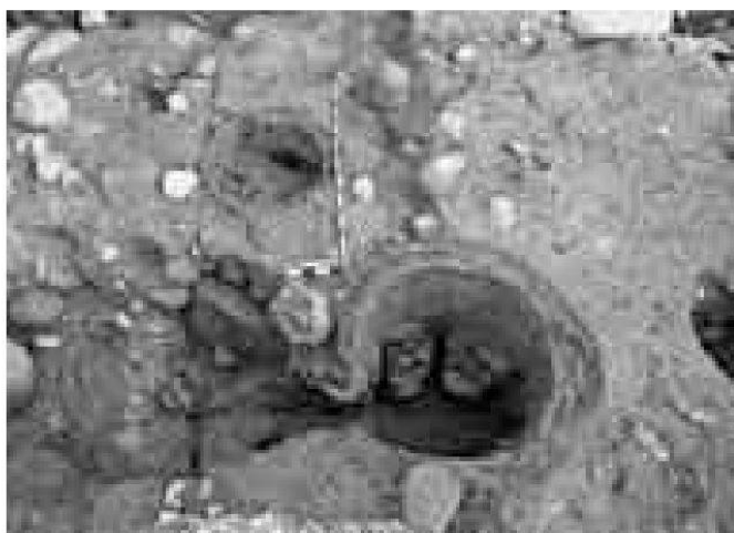
Grabung Baden-Kurpark. Blick in die beiden römischen Töpferöfen. Einfeuerungskanal und Lochtenne des oberen Ofens sind noch weitestgehend erhalten.