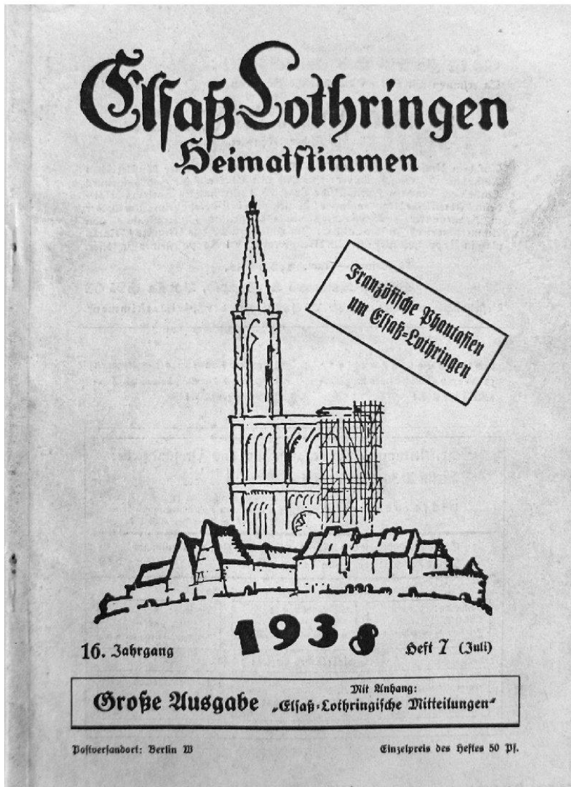
Ein Exemplar der «Elsass-Lothringen Heimatstimmen» aus dem Jahr 1938.