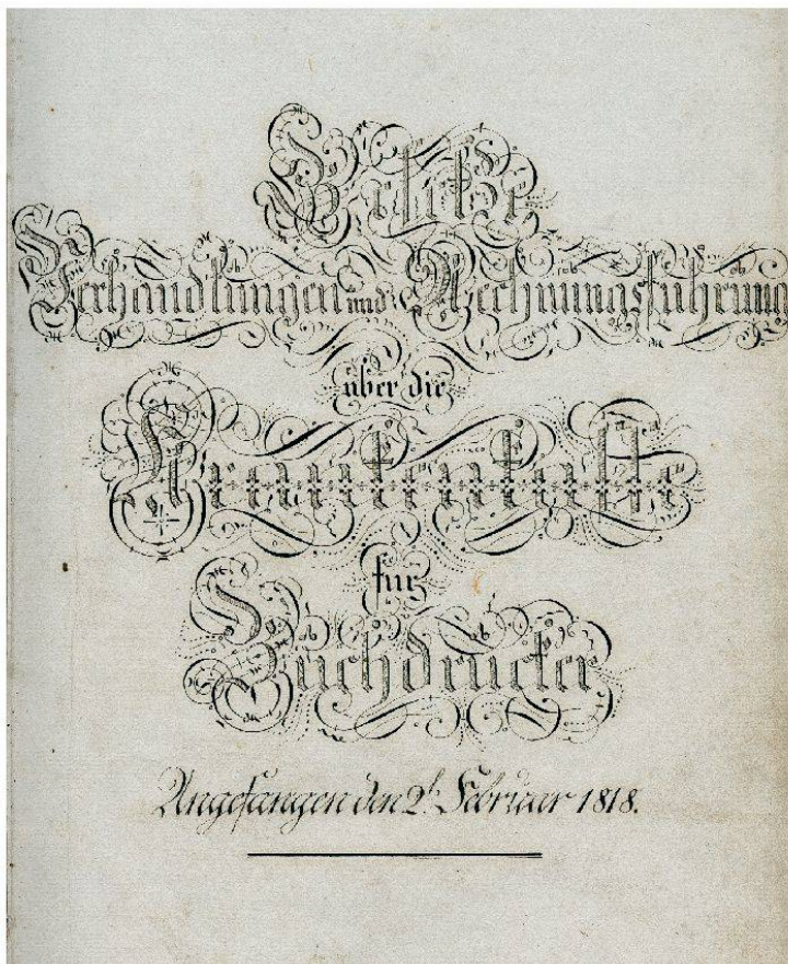
Buchumschlag der Krankenkasse für Buchdrucker 1818–1868 (StAAG NL.A-0283/51.1.10447).

pitalistischen Wirtschaftsweise einerseits und praktische Reformanstrengung zur Verbesserung der Lebensverhältnisse der Arbeitnehmenden greifen ineinander – wobei die erstere unter der Last des gewerkschaftlichen Alltagsgeschäfts oft vergessen zu gehen droht.» 3 Die Archive der Aargauer Arbeiterbewegung dokumentieren dieses Spannungsverhältnis mit: