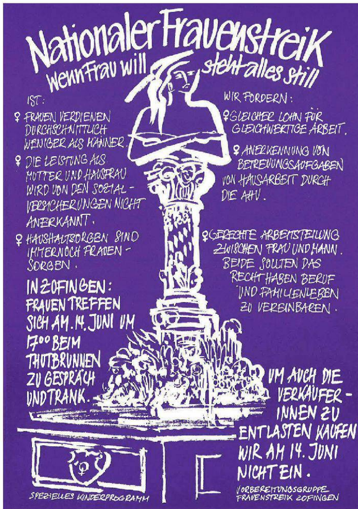
Plakat zum Nationalen Frauenstreiktag in Zofingen 1991 (Aarg. Gewerkschaftsbund).

politische Fortschritt seit Jahrzehnten, der frühzeitige Altersrücktritt ab 60 für die Bauarbeiter, im 2002 auf Aargauer Boden am Baregg entschieden.» 9 Nachdem im Jahr 2000 das Streikrecht in der Bundesverfassung verankert wurde – kann nicht mehr davon gesprochen werden, dass «der Streik etwas Verbotenes oder zumindest «Unschweizerisches» sei», 10 wie das in den streikarmen Jahrzehnten behauptet wurde.