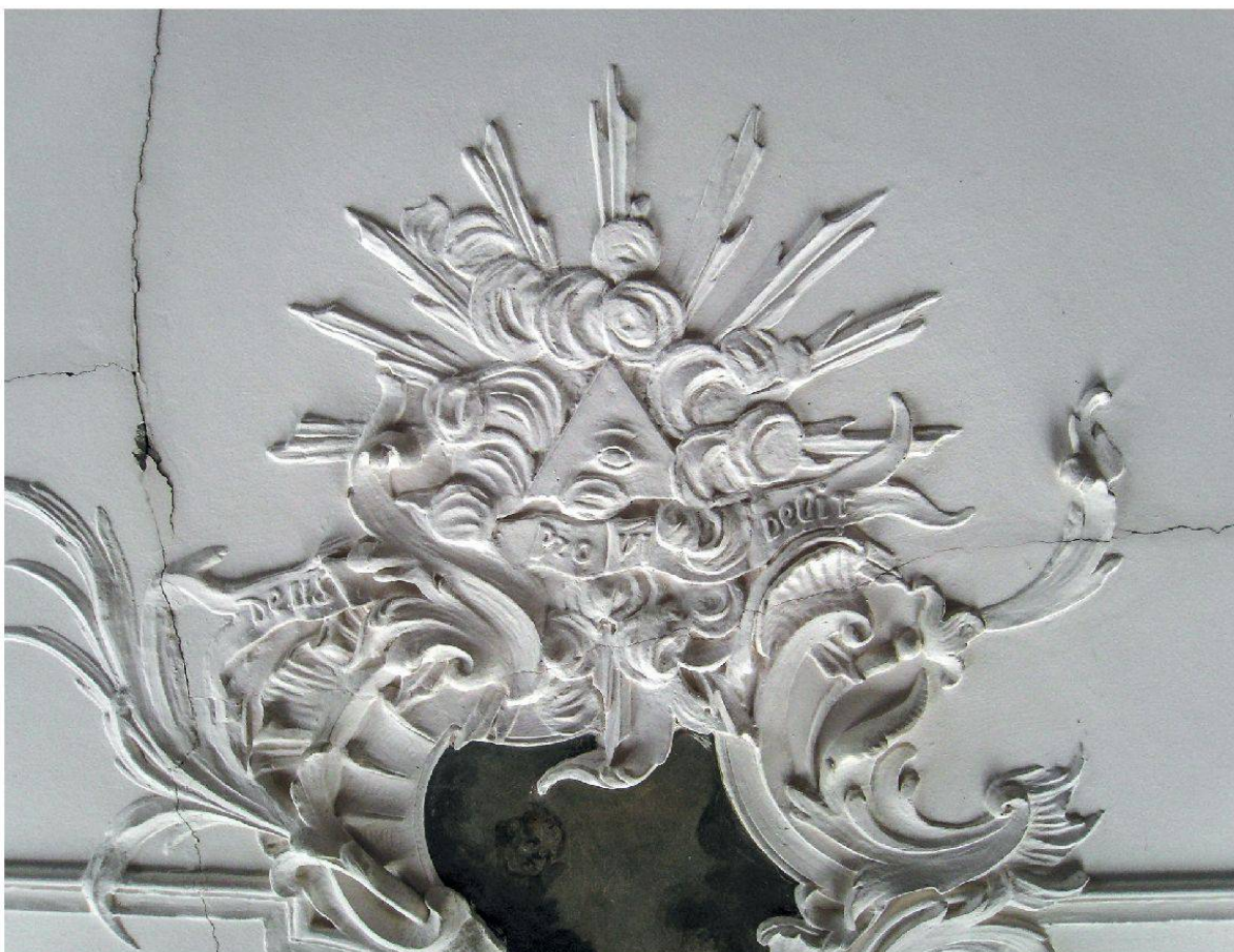
21 Hornussen, Gasthaus zum Schwert: Mittelkartusche mit Auge Gottes und Inschrift «Deus providebit». Johann Michael Hennevogel, ca. 1750.