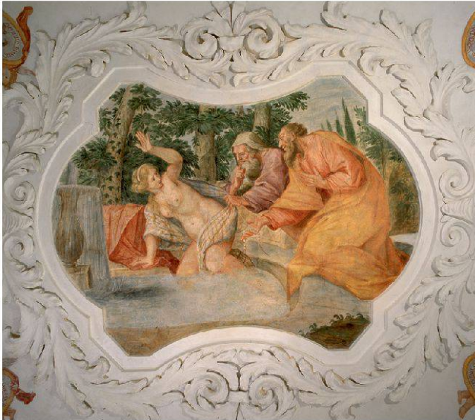
5 Schnecklingen, Schneckli, 2. Obergeschoss, Nordostzimmer: Stuckaturen rahmen das Decken- gemälde der badenden Susanna, Giovanni Battista Tiepolo, 1696–1698.