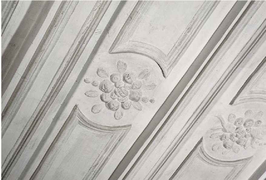
8 Schneisingen, Schössli, 2. Obergeschoss: Korridor mit stuckierter Balkendecke. Giovanni Bettini, 1696–1698.

und auch die Muschel der Supraporte im selben Raum auf das gemalte Thema Bezug (Abb. 6).