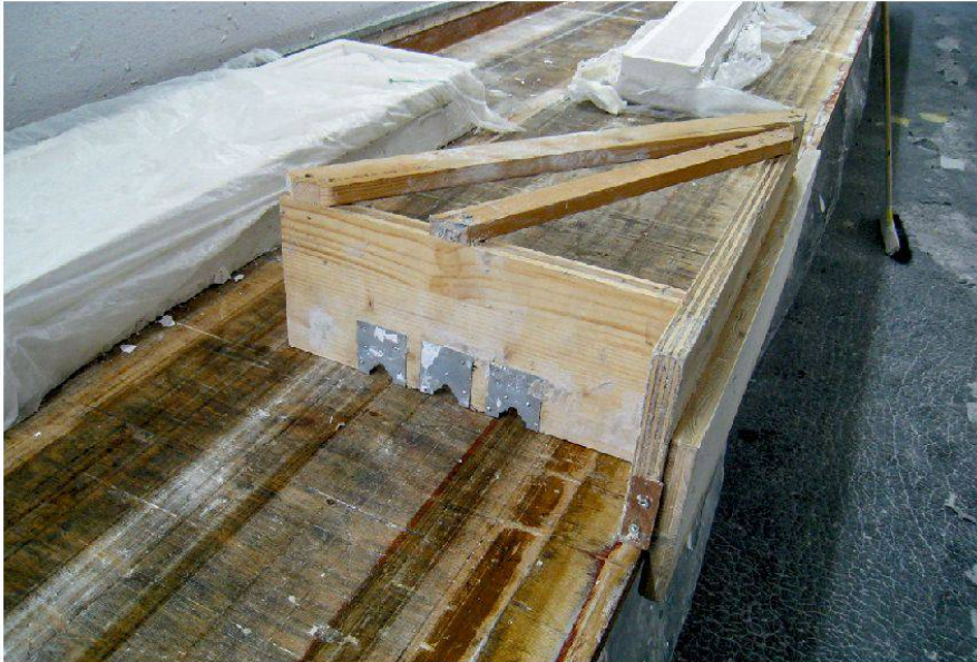
12 Schablone mit Schlitten zum Ziehen von Profilleisten in der Werkstatt des eidg. dipl. Stuckateurs Frank Jäggi, Langenthal.