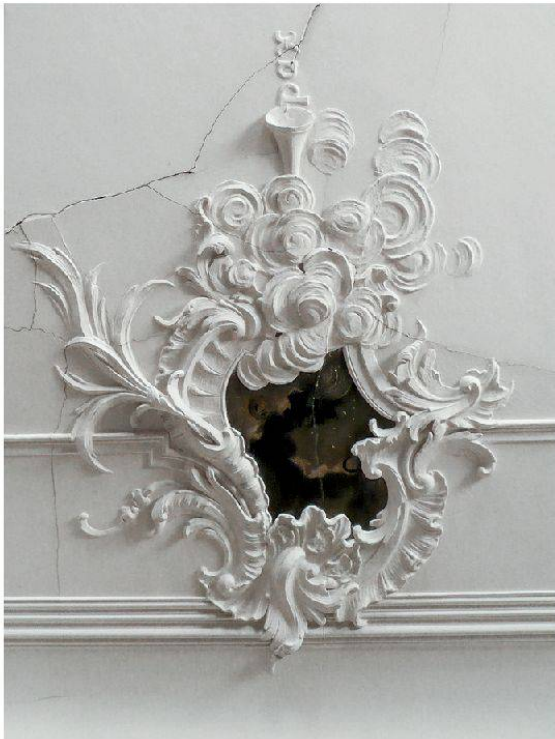
22 Hornussen, Gasthaus zum Schwert: Mittelkartusche mit Trompete und Inschrift «pax». Johann Michael Hennevogel, ca. 1750.