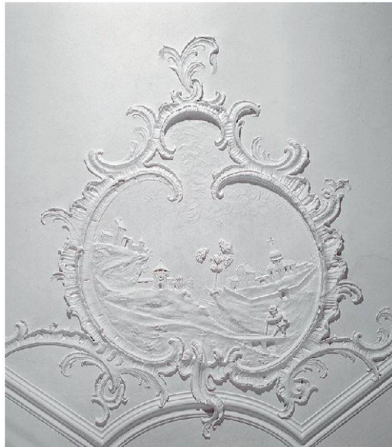
26 Rheinfelden, Gasthaus zum Goldenen Adler: Kartusche in der Südwestecke mit Wanderer. Johann Martin Fröwis (gest. 1795) (Foto: Kantonale Denkmalpflege Aargau, Christine Seiler, 2013).