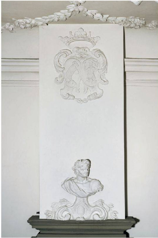
10 Lenzburg, Burghalde: Allianzwappen Gernler-Spengler über dem Kamin, 1710.