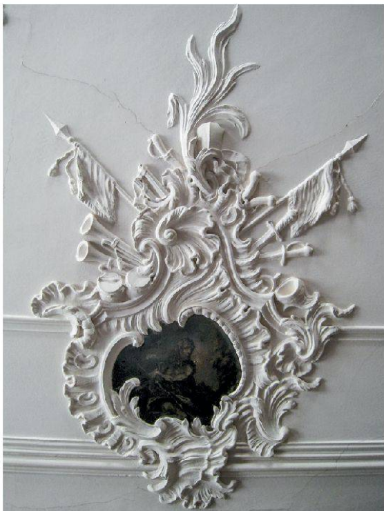
20 Hornussen, Gasthaus zum Schwert: Mittelkartusche mit Kriegselementen. Johann Michael Hennevogel, ca. 1750 (Foto: Kantonale Denkmalpflege Aargau, Franziska Schärer, 2011).