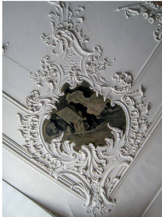
19 Hornussen, Gasthaus zum Schwert: Eckkartusche mit Wasserlandschaft. Johann Michael Hennevogel, ca. 1750.

die aus dem Wolkenrahmen des anderen Bildes ragt, lässt mit der Inschrift «pax» den Ruf nach Frieden erklingen (Abb. 22). Das Bildmedaillon selbst zeigt Engelsgesichter und Gestirne.