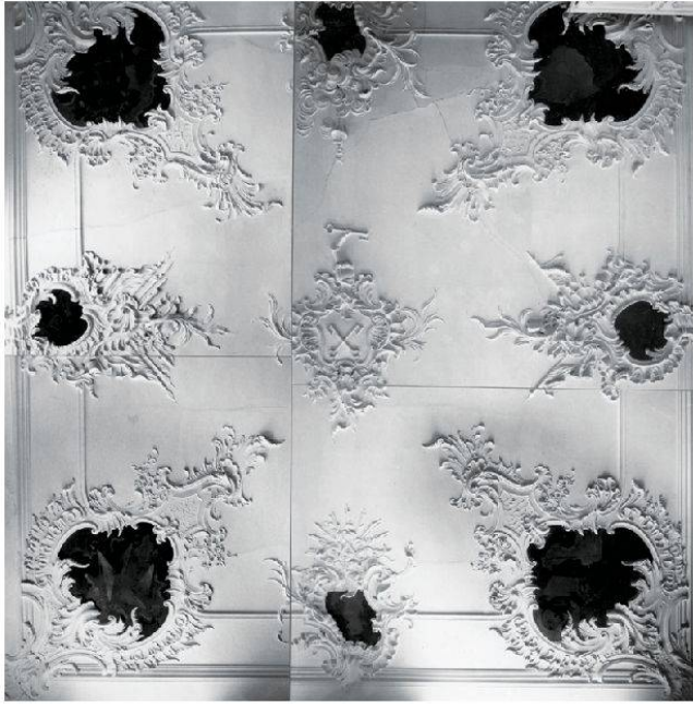
17 Hornussen, Gasthaus zum Schwert: Gesamtansicht der Decke. Johann Michael Hennevogel, ca. 1750.

Die Kartusche endet oben mit einer Helmzier, deren Hand wiederum einen Schlüssel hält. Auch hier sind entlang des profilierten Stabes über der Hohlkehle je vier Eck- und Mittelkartuschen stuckiert, die sich um das Wappen der Familie Keller gruppieren.