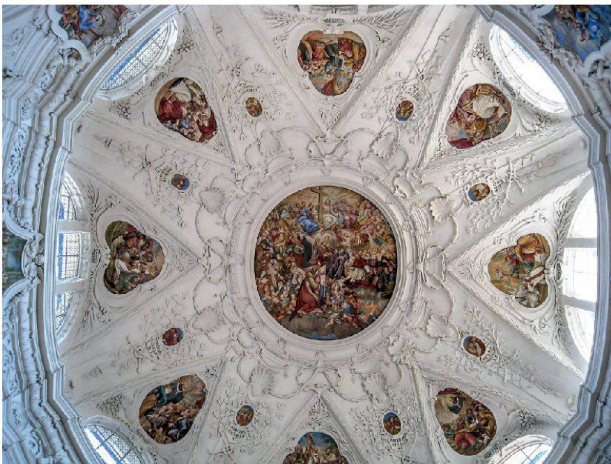
2 Klosterkirche Muri: Oktogon mit Stuckaturen von Giovanni Battista Bettini, 1695–1697.