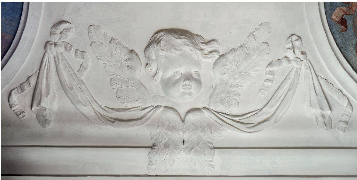
9 Schneisingen, Schlössli, 1. Obergeschoss, Nordostzimmer: Engelskopf in Relief zwischen Eckmedaillons. Giovanni Bettini, 1696–1698 (Foto: Kantonale Denkmalpflege Aargau, Christine Seiler, 2013).

und wirkt wie Malerei. Die in der Barockzeit beliebten Engelmotive zieren also nicht nur sakrale Bauten, sondern auch private Salons.