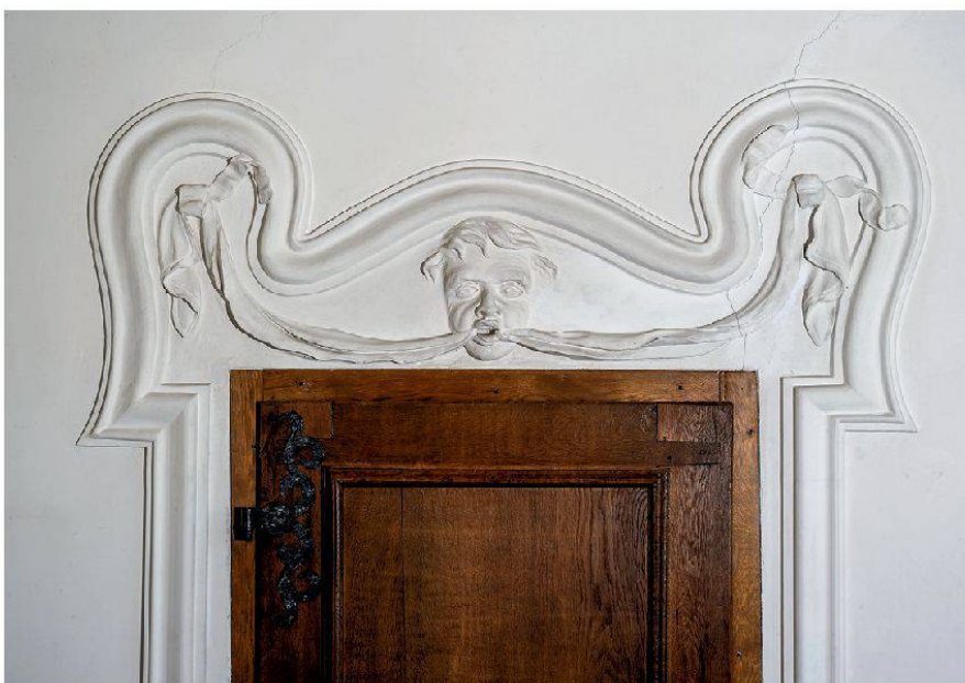
7 Schneisingen, Schlössli, 2. Obergeschoss, Südostzimmer: Supraporte mit Maske. Giovanni Bettini, 1696–1698 (Foto: Kantonale Denkmalpflege Aargau, Christine Seiler, 2013).