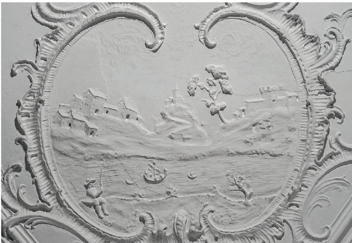
25 Rheinfelden, Gasthaus zum Goldenen Adler: Detail der nordwestlichen Eckkartusche mit Fischer. Johann Martin Fröwis (gest. 1795) (Foto: Kantonale Denkmalpflege Aargau, Christine Seiler, 2013).