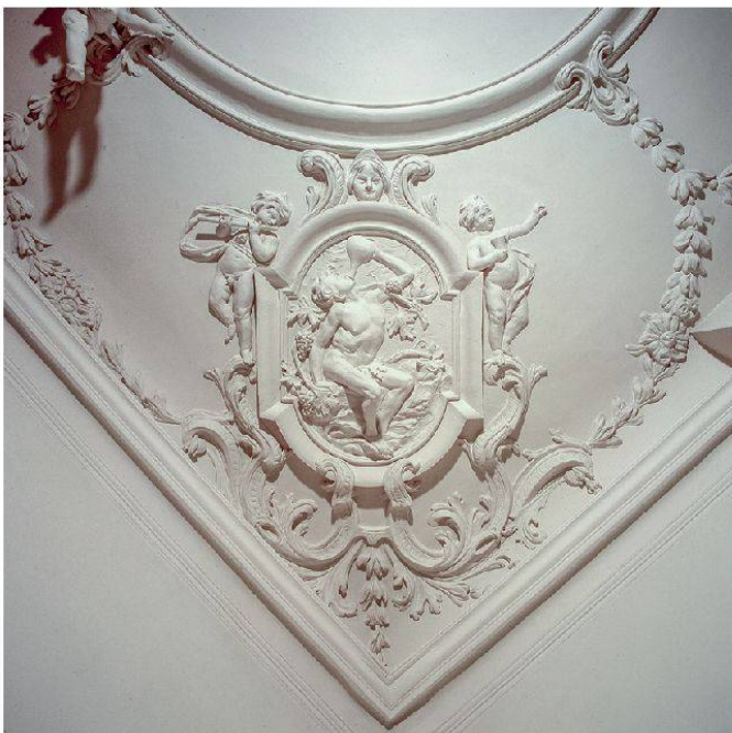
14 Lenzburg, Burghalde: Vollplastischer Putto am Mittelmedaillon, 1710 (Foto: Kantonale Denkmalpflege Aargau, Christine Seiler, 2013).