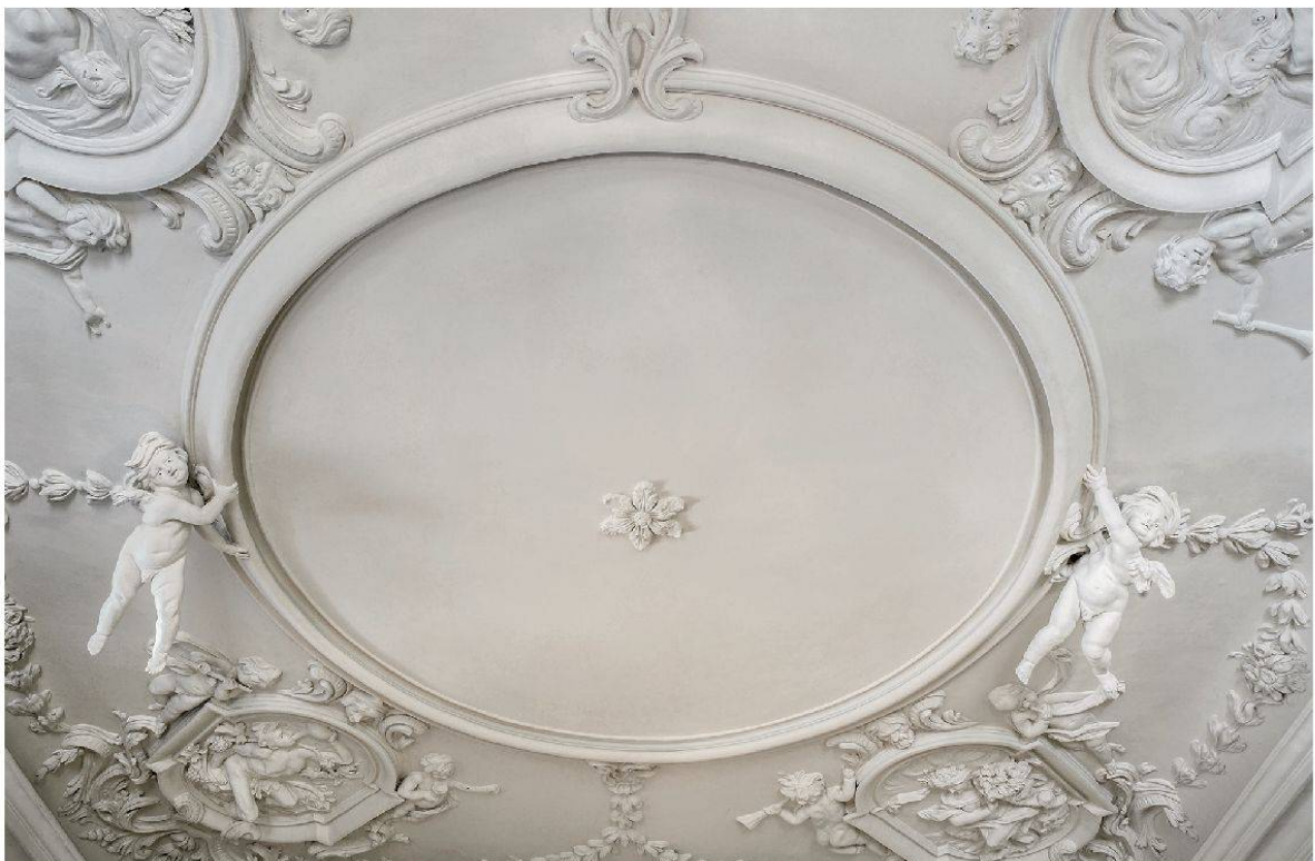
11 Lenzburg, Burghalde: Barockstuckdecke, 1710 (Foto: Kantonale Denkmalpflege Aargau, Christine Seiler, 2013).