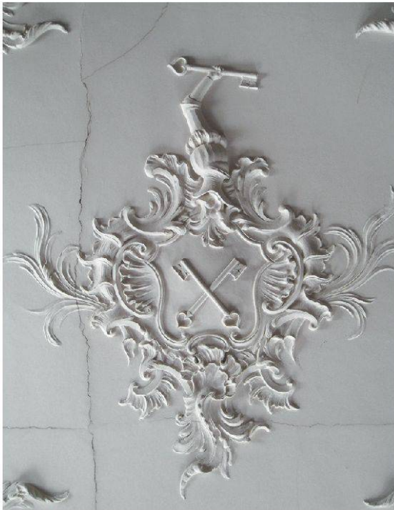
18 Hornussen, Gasthaus zum Schwert: Wappen der Familie Keller. Johann Michael Hennevogel, ca. 1750 (Foto: Kantonale Denkmalpflege Aargau, Franziska Schärer, 2011).