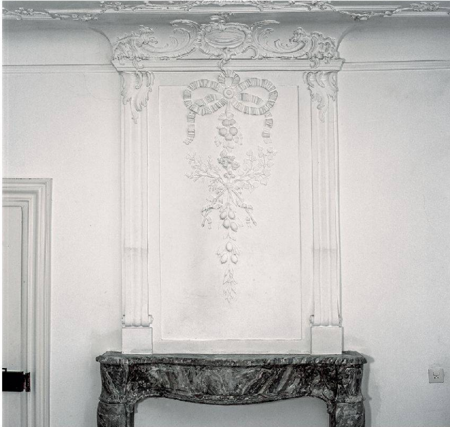
27 Rheinfelden, Gasthaus zum Goldenen Adler: Astgebilde mit Zitronen. Johann Martin Fröwis (gest. 1795).

Landschaftsszenereien zeigen die Wände mit Maschen gebundene, arrangierte Pflanzen- und Früchtesorten. Das Stuckprogramm lässt so für den vornehmen Besitzer und seine Gäste den Innenraum zu einem Aussenraum werden.