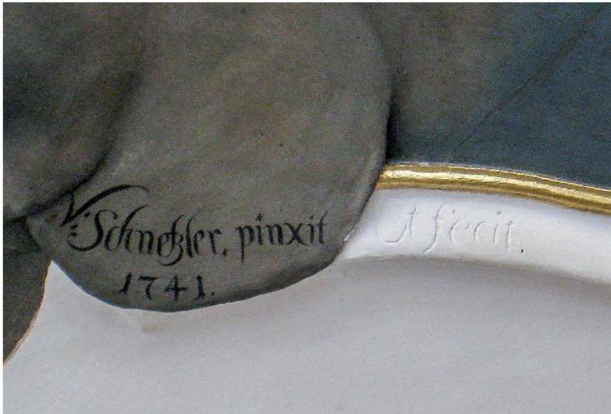
3 Aarau, Regierungsgebäude: Decke mit Gemälde und Stuckaturen, gemäss Maler- und Stuckateurunterschrift von Johann Ulrich Schnetzler, 1741 (Foto: Kantonale Denkmalpflege Aargau, Franziska Schärer, 2011).

Schärer, auch die Stuckarbeiten zu. 10 Neben seiner Signatur als Maler bestätigt der Künstler im Stuckrahmen des Gemäldes mit dem schlichten «et fecit» seine Arbeit als Stuckateur (Abb. 3).