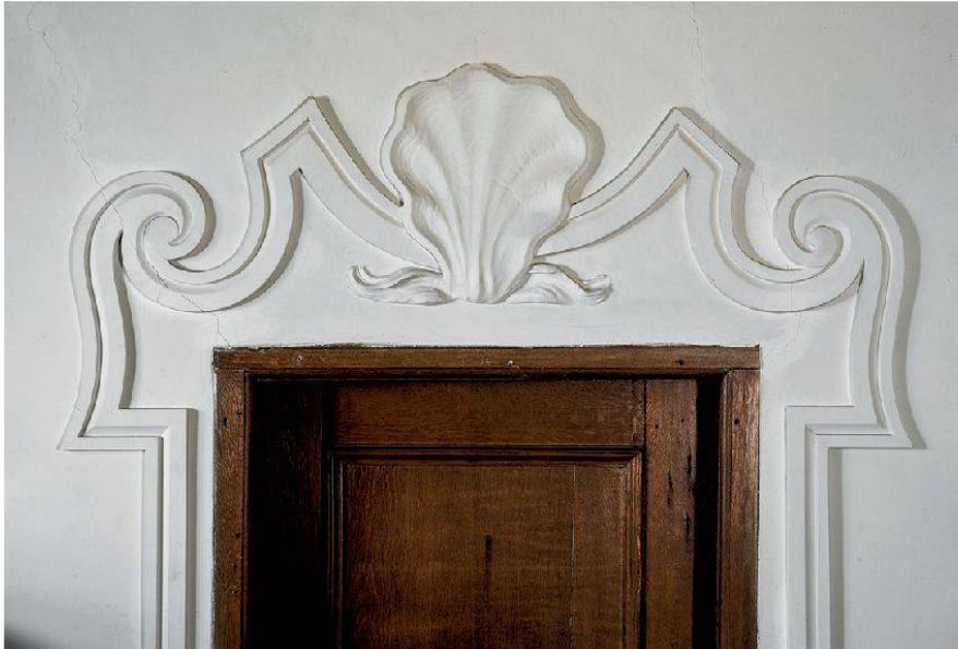
6 Schneisingen, Schlössli, 2. Obergeschoss, Nordostzimmer: Supraporte. Giovanni Bettini, 1696–1698.