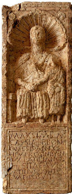
3 Brugg, Remigersteig: Der im Herbst 2012 entdeckte römische Grabstein für zwei Zivilistinnen aus Vindonissa (KA AG, Inv. Nr. Bru.012.2/172.1).

tigung sowie Pfähle und Schalhölzer der Gebäudefundamentierung geben einen Einblick in die aufwendige Bauweise, die dennoch den Naturkräften nicht gewachsen war (Abb. 4). Die über 500 entnommenen Holzproben zur dendrochronologischen Datierung der Befunde werden wichtige Grundlagen zur absoluten Datierung des Baus und verschiedener Umbauten der grossen römischen Thermenanlage liefern. Noch ausstehend sind die Grabungen im Bereich Park-/Bäderstrasse, die aus technischen Gründen erst unmittelbar vor oder mit Baubeginn der neuen Therme durchgeführt werden können. Ausserdem fehlen noch die abbruch- und baubegleitenden Massnahmen im Bereich der bestehenden Bauten sowie allenfalls Grabungen und Baubegleitungen im Zuge der Neugestaltung des öffentlichen Raums. Bei der Werkleitungssanierung im Blumengässli konnte erstmals Einblick in den Boden südlich des Kurplatzes gewonnen werden. Hier zeigten sich bislang unbekannte römische und mittelalterliche Mauerzüge. Im Bereich eines Strebepfeilers an der Nordost-ecke des Hotels «Blume» wurde in 1,6 m Tiefe eine mittels Radiokarbondatierung ins 1. Jh. n. Chr. datierte Holzkonstruktion beobachtet, womit ein weiteres Indiz für die Ausdehnung der römischen Thermenanlagen auf den Bereich des heutigen Kurplatzes vorliegt.