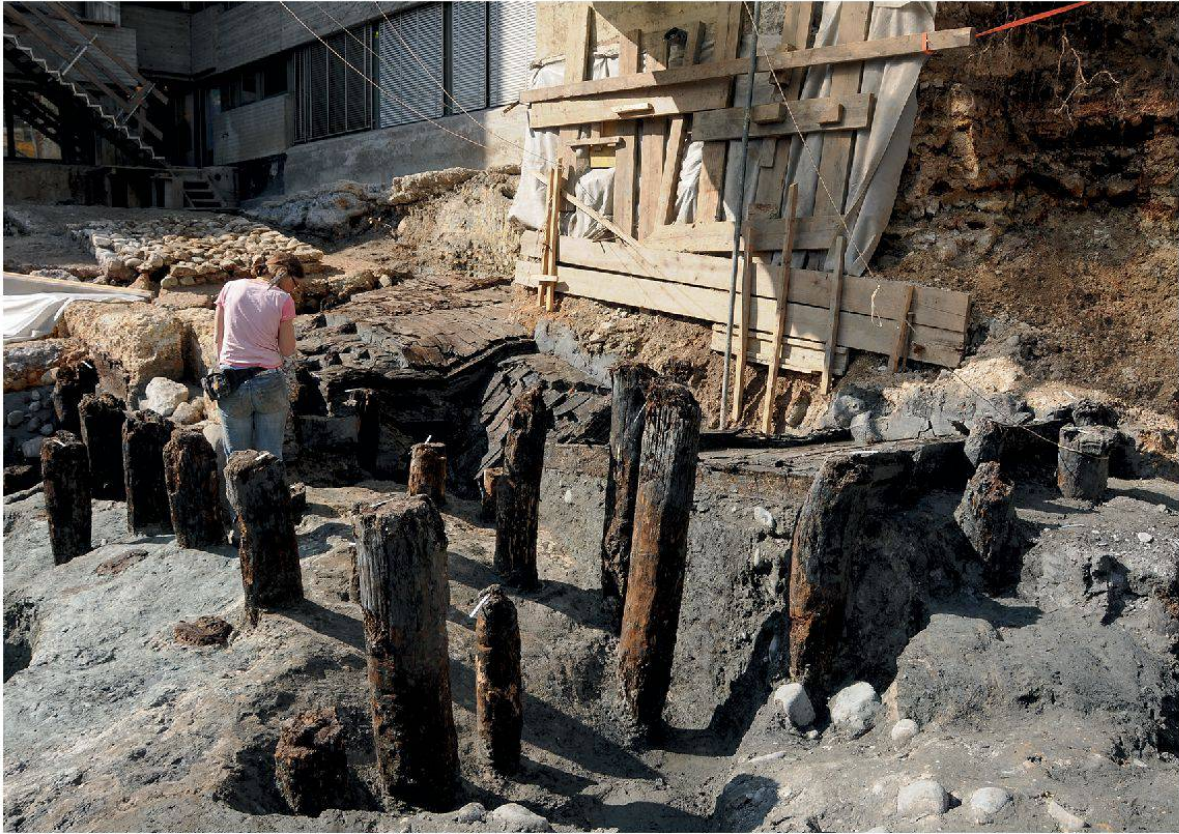
4 Baden, Grabung Limmatknie: Dokumentation der Holzkonstruktionen der römischen Fundamentierungen.

Buchs: Im Dorfzentrum, nördlich der Erhebung Bühlrain, an deren Nordhang die Mauerreste des 1955 entdeckten römischen Gutshofes herausragen, findet seit Anfang 2012 die Überbauung des etwa 1,2 ha grossen Areals «Oberdorf» statt. An dessen südlichem Rand konnten die Reste des Nordwesttraktes der Wirtschaftsanlage des Gutshofes erfasst werden. Aufgrund des Befundes handelt es sich um eine Axialanlage. Entdeckt wurden zwei zweiphasige, freistehende Gebäude, die in einer Achse angeordnet sind. Die Konstruktionen wirken dank einer Umfassungsmauer wie ein abgeschlossener Trakt. Diese Mauer schliesst die offene Fläche zwischen den Gebäuden, wo sich vermutlich der zentrale Innenhof befand, nach Süden hin ab. Landseitig konnte keine Umfassungsmauer festgestellt werden. Von den erfassten Gebäuden haben sich vorwiegend die im Boden eingetieften Fundamente aus Flusskieseln erhalten. Nur bei den Bauten der älteren Phase sind punktuell die Tuffsteinquader der ersten Lage des aufgehenden Mauerwerks noch vorhanden. Zur ersten Bauphase gehört im Osten des erfassten Traktes ein rechteckiges Gebäude von 15,5 m Breite und mindestens 23 m Länge. Da in der nächsten Bauphase die Nutzungsschicht abgetragen wurde, fehlen jegliche Hinweise auf eine mögliche Teilung des Innenraumes. Der westliche Bau konnte sehr beschränkt erfasst werden. Seine Breite beträgt 10,50 m und wird in zwei unterschiedlich grosse, west-östlich orientierte Räume