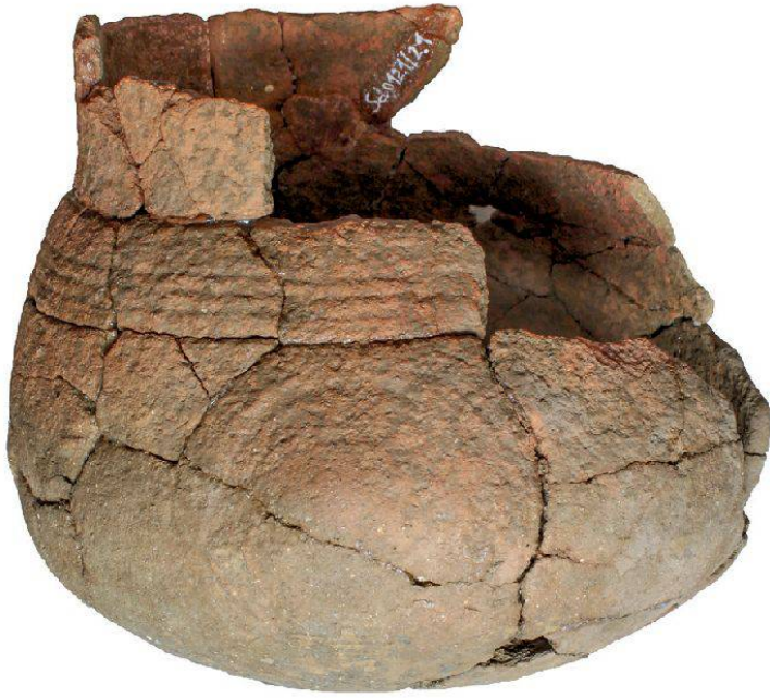
9 Schinznach-Dorf, Strick: Restauriertes Henkelgefäss mit Buckel- und Rillenverzierung aus einem der erfassten Gräber.

gedient haben. Bald verloren diese Strukturen an Bedeutung, wurden aufgegeben und zugeschüttet, um schliesslich in der zweiten Besiedlungsphase als Siedlungsfläche zu dienen. Baubefunde sind erst in der dritten Besiedlungsphase fassbar. Es handelt sich um eine Pfostenreihe und um plattige Unterlagsteine, die vermutlich zu einer Pfostenriegelkonstruktion gehört haben.