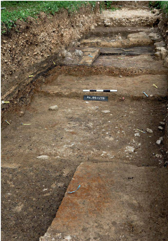
5 Frick, Gäsacker: Blick auf die sondierte, abgestufte Fläche. Jede Stufe entspricht einer der festgestellten Bauphasen.

Anfang an gebaut wurde. Während einige etwa fünfzig Jahre brachlagen oder zumindest unbebaut blieben, wurden auf anderen antiken Parzellen mehrere Phasen von Holz- und Lehmfachwerkgebäuden erkannt. Das Einsetzen der Steinbauweise ist auch nicht überall gleichzeitig erfolgt.