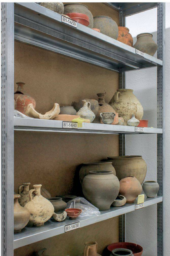
15 Keramik aus der Gräberstrasse «Aarauerstrasse», die während der Grabung Brugg-Aarauerstrasse 1937 (Bru.37.1) gefunden wurde.