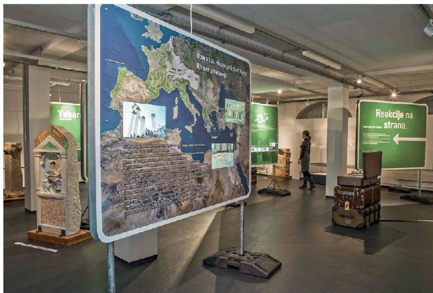
16 Vindonissa-Museum: Blick in die Ausstellung «Überall zu Hause und doch fremd – Römer unterwegs».

Die Besucherzahlen liegen mit insgesamt 11 591 Eintritten praktisch gleich hoch wie im Vorjahr. Der Rückgang der vermittelten Führungen und Workshops wurde offenbar von den Stadtführungen aufgefangen.