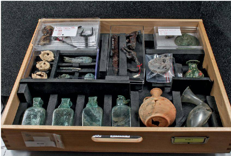
14 Schublade mit Funden aus den Gräberstrassen von Brugg. Im Vordergrund Teile des Ensembles eines Ziegelkistengrabes, das während der Grabung Brugg-Bahnhofsareal 1923 geborgen wurde (Bru.23.1).