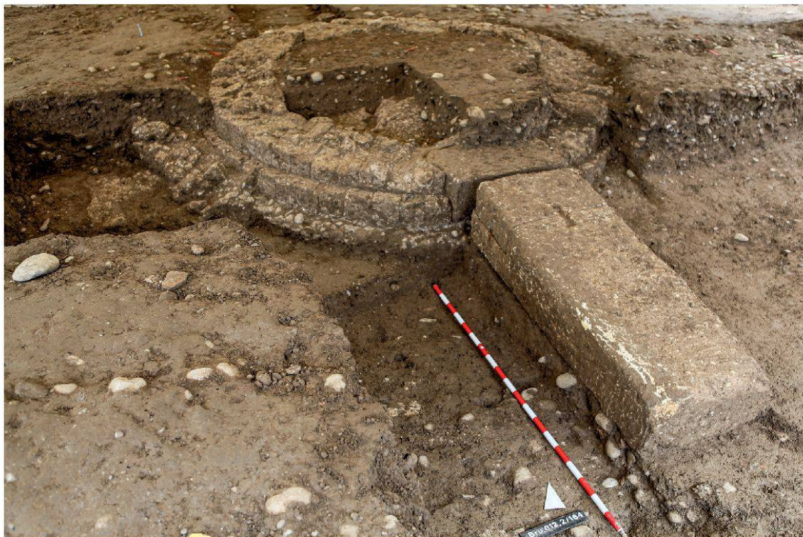
1 Brugg AG, Remigersteig: Grabungsfoto mit Grabstein, dahinter der Rundbau mit integriertem Grabstein-Sockel.