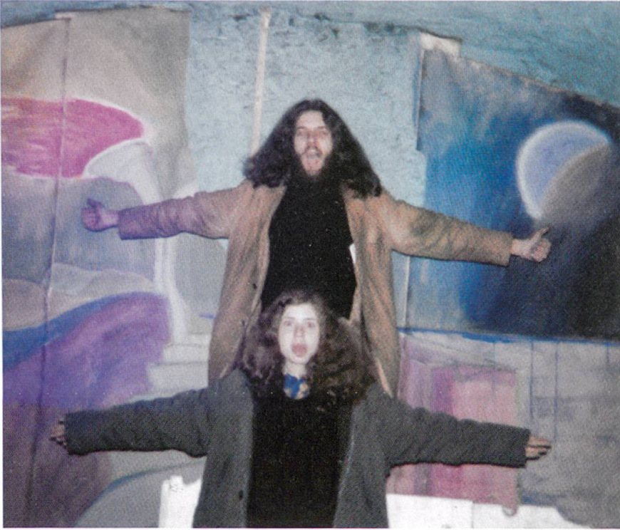
8 Der Musikraum an der Badenerstrasse 165 war mit grossflächigen Wandbildern dekoriert. Diese schufen die Atmosphäre, in der in nächtelangem Musikmachen die Klänge und Lieder entstanden, nach denen «Lovecraft» suchte.