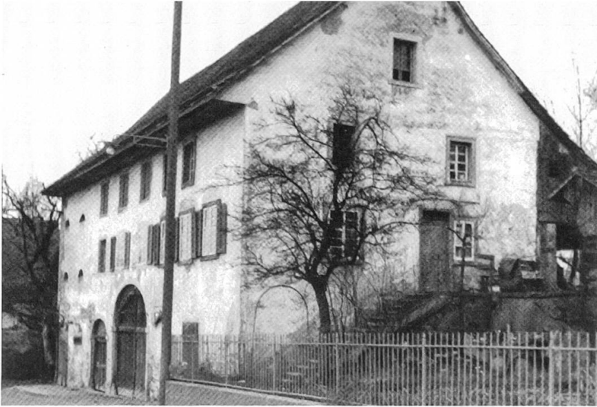
1 Das ehemalige Vielzweckbauernhaus an der Badenerstrasse 165 (heute 33) in Birmenstorf stammt aus der ersten Hälfte des 19. Jahrhunderts. Es bot in den frühen 1970er-Jahren den nötigen Platz und den Freiraum für gesellschaftliche Experimente.

Die Birmenstorfer Wohngemeinschaft war zu keiner Zeit politisch motiviert. Eine Verbindung zu Bewegungen wie den «Progressiven Organisationen der Schweiz» (POCH), der «Revolutionären Marxistischen Liga» (RML) oder zum lokalen «team 1967» in Baden gab es nicht. Sie vernetzte sich auch nicht mit anderen Genossenschaften, Interessengruppen oder Wohngemeinschaften. «Wir waren einfach gegen alles. Aber im Umfeld der 1968er-Unruhen.» 12 Viele Bewohner der Badenerstrasse 165 verweigerten den Militärdienst, wobei auch bei ihnen «[...] der Vietnamkrieg als politischer Katalysator für eine ganze Generation [...]» 13 diente. Die nachfolgenden Gefängnisstrafen und das Leben im «offenen Haus» ermöglichten einen performativen Ausbruch aus der bürgerlichen Gesellschaft. 14 Feste Normen mit einem geordneten Arbeitsverhältnis, Militärdienst, Vereinszugehörigkeit, religiösem Bekenntnis und legalisiertem Familienleben wurden rundweg abgelehnt. Der Wunsch nach einem alternativen Lebensentwurf war oft aus den persönlichen Erfahrungen in der Kindheit und Jugend der Betroffenen zu verstehen.