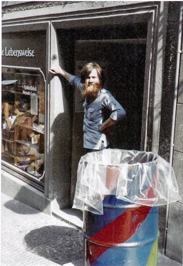
11 Von 1975 bis 1979 bestand das erfolgreiche «Haldelädeli» in Baden. Es versorgte jene, die sich alternativ ernähren wollten, mit biologischen Nahrungsmitteln auch auf dem Badener Wochenmarkt (Sammlung Felix Bugmann).

Im Frühjahr 1973 mussten daher die letzten Bewohner aus dem Haus wegziehen. Sie schlossen sich zu einer neuen Lebensgemeinschaft zusammen. Auf dem Hof Gauchen im sanktgallischen Gähwil fanden sie bis zum Frühjahr 1975 eine weitere Bleibe, wo auch Zukunftspläne reiften. Das Ideal wäre für einige von ihnen die gemeinschaftliche Produktion gesunder Nahrungsmittel auf einem Bauernhof gewesen. Neben der Selbstversorgung hätte man Zeit zum Musikmachen gefunden, und die zahlreichen eigenen Kinder hätten die Ideen ihrer Eltern weiterentwickeln und weitertragen sollen.