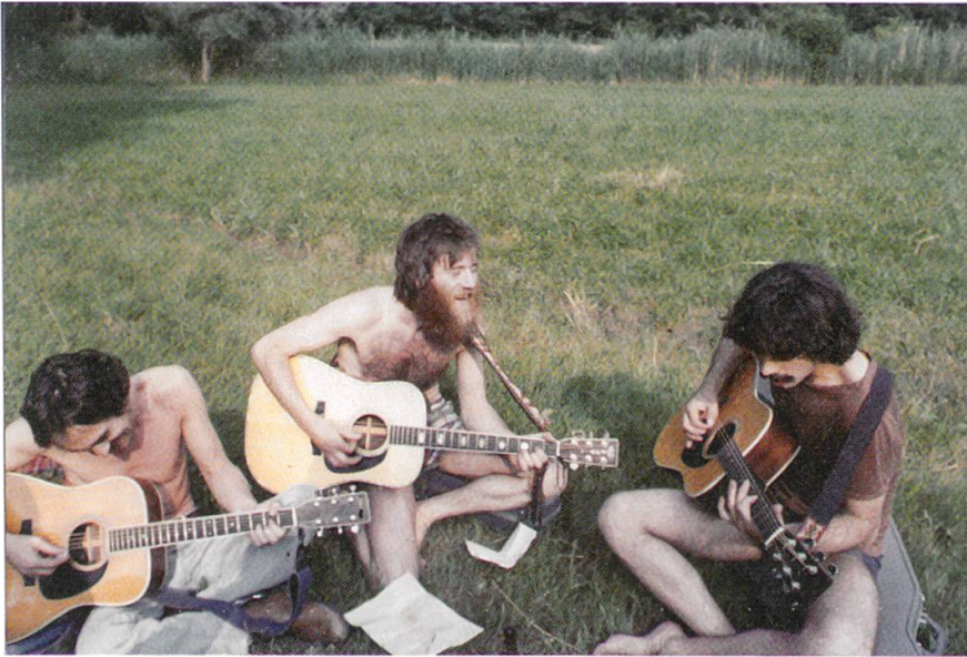
2 Zur Suche nach sich selbst und dem Sinn des Lebens gehörte ungezwungenes Zusammensein bei Musik und Diskussionen, wie hier 1979 in Gippingen in der freien Natur.