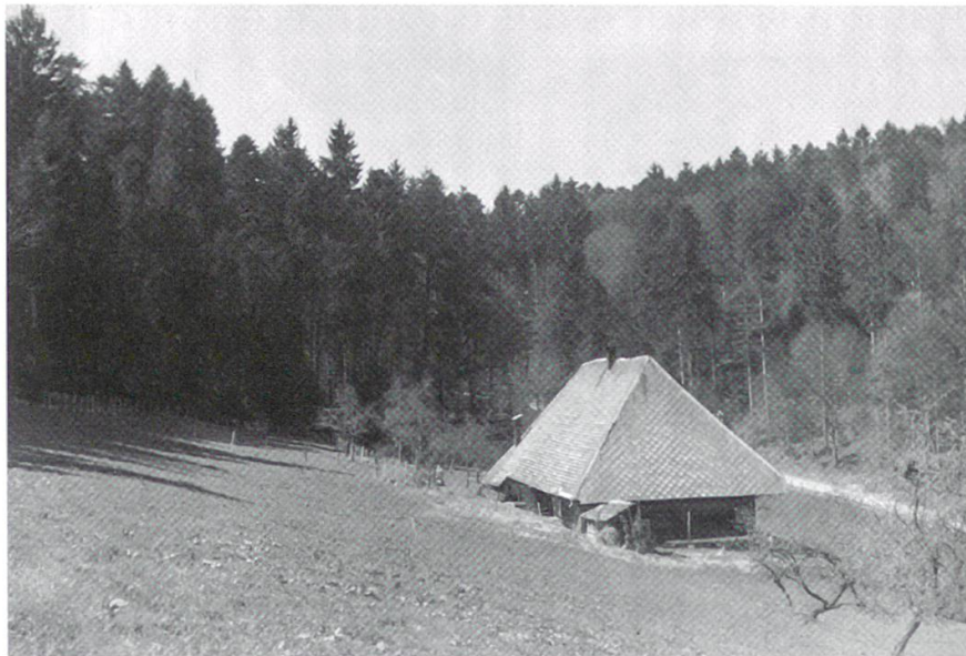
3 Schon in Bottenwil im Aargauer Teil des Uerketals unterhielten von Dritten «Hippies» Genannte vor 1970 ein «offenes Haus» in einem abgelegenen ehemaligen Bauernhaus. Sie zogen im Frühjahr 1971 nach Birmensdorf (Sammlung Ewa Jonsson).