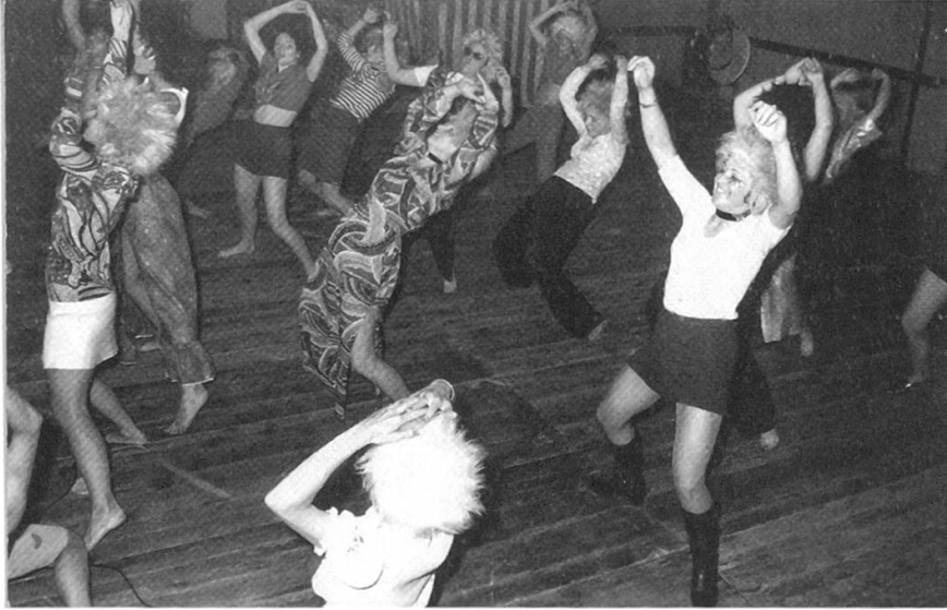
12 Der wilde Tanz des Turnerinnen-Sportvereins Birmenstorf ging im Jahr 1970 über die Bühne der «Alten Trotte». Er war inspiriert von der «Hippie»-Bewegung und dem Musical «Hair» (Sammlung TISV Birmenstorf).

Etwas weniger erfolgreich war der Betrieb des «Rüssbrugg-Lädeli» in Bremgarten, das schon nach zehn Monaten in Konkurs ging.