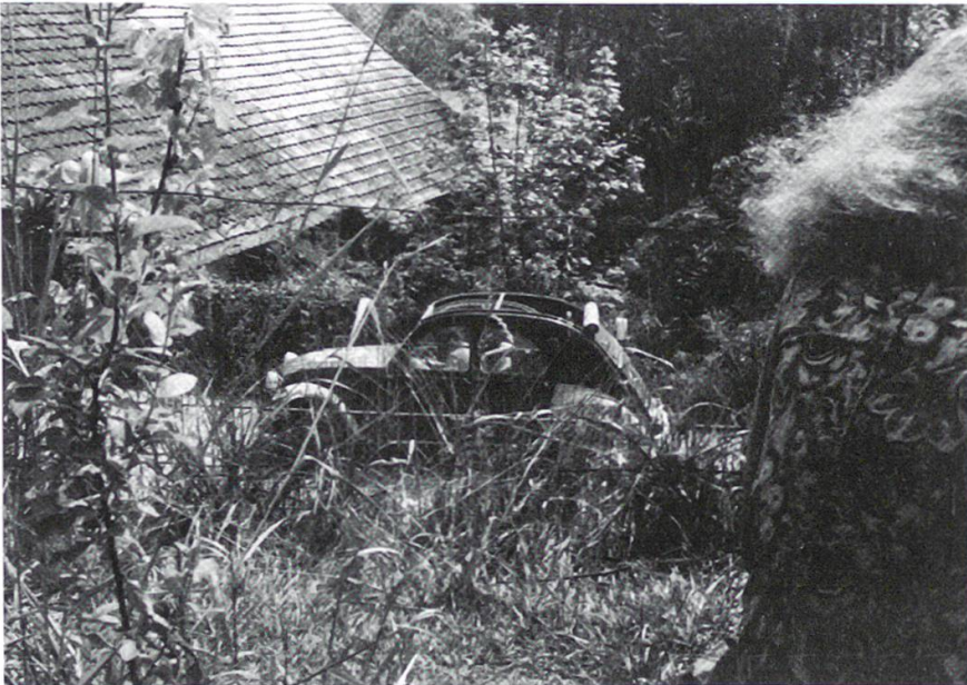
9 Der Citroën «Deux Chevaux» hinter der Badenerstrasse 165 verkörperte das Lebensgefühl einer ganzen Generation. Er brachte «Lovecraft» an Konzerte und die Wohngemeinschaft an das Fischbacher Mösli und ermöglichte durch die Mobilität ein Stück Freiheit.