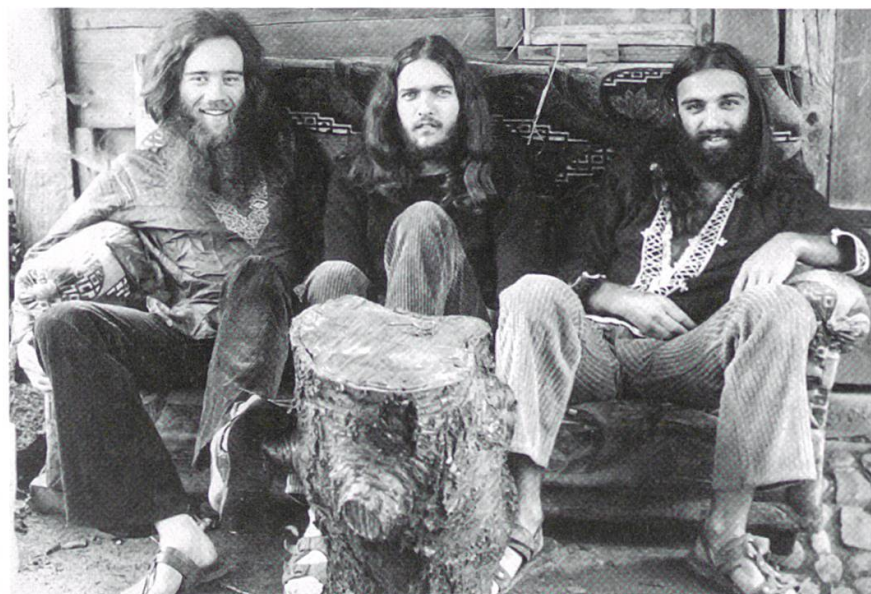
4 Die Band «Lovecraft» bildete den Dreh- und Angelpunkt der Wohn-gemeinschaft. Die jungen Leute waren auf der Suche, grenzten sich mit ihrem Äusseren und ihrer Musik von der Mehrheits-gesellschaft ab.