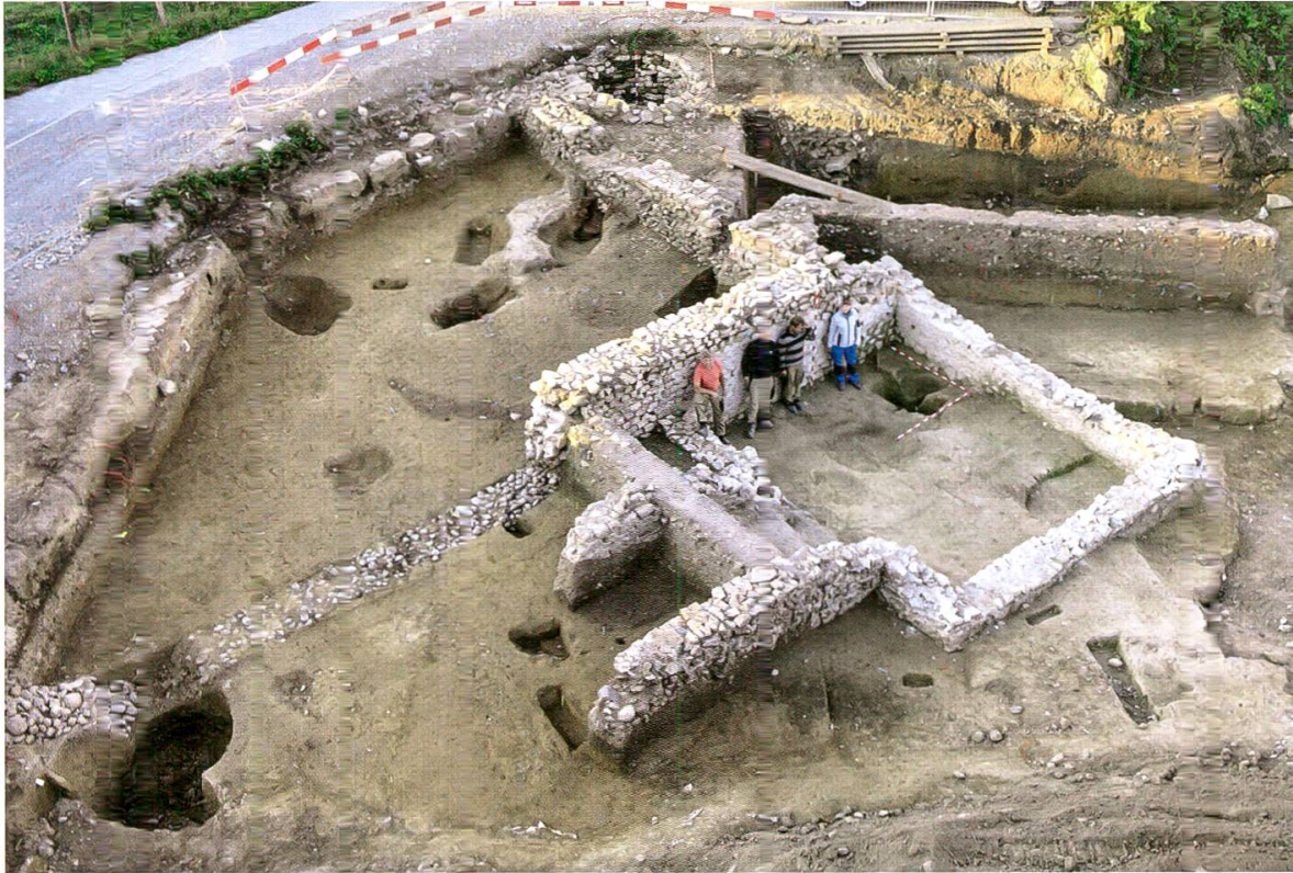
6 Windisch-Zürcherstrasse (Urech). Blick von Nordosten auf den römischen Steinkeller und den trocken gemauerten Schacht (im Hintergrund).