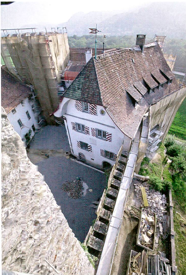
13 Veltheim-Schloss Wildenstein. Der Innenhof des Schlosses während den laufenden Renovationsarbeiten. Links die Umfassungsmauer (frühes 15. Jh.), in der Mitte der Südwestturm (Mitte 14. Jh.), rechts der Westtrakt (20. Jh.).