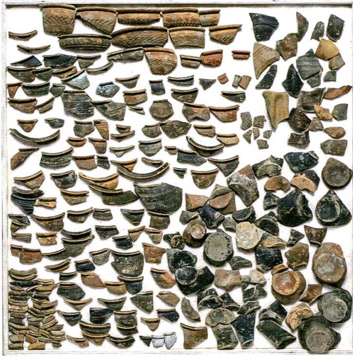
15 Grosse Fundmengen: Das Inventarisieren von Fundmengen grösserer Grabungen fordert das Team der Fundverwaltung. Hier als Beispiel römische Keramik aus der Grabung Laufenburg-Sieche- bifang 2013–2014, die 2016 fertig inventarisiert werden konnte.