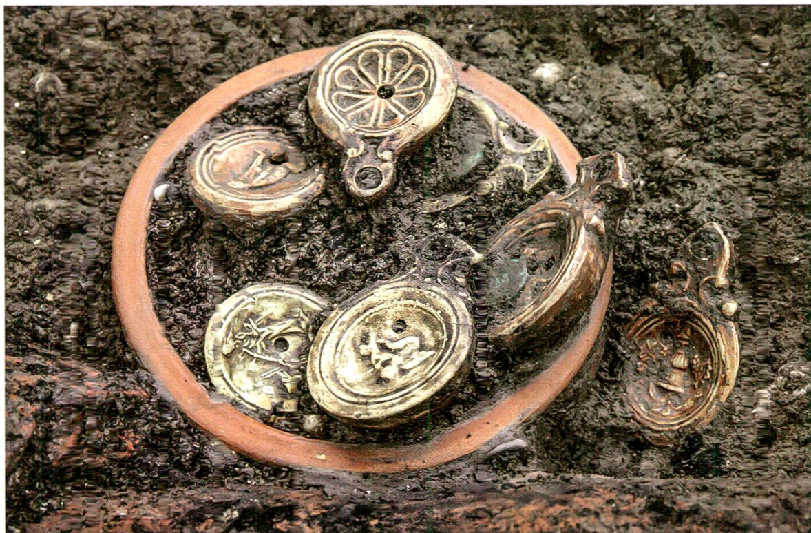
7 Windisch-Zürcherstrasse (Urech). Vollständige Keramikschüssel («Ware der 11. Legion»), angefüllt mit Brandschutt, Bildlampen und Münzen. Situation vor der Blockbergung.