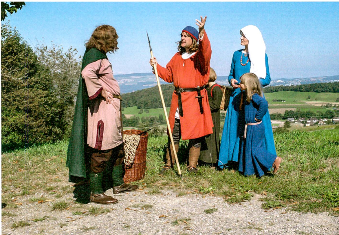
3 Erlebnisfahrt «100 000 Jahre Lebensraum Aargau». Darsteller von «Zähringervolk Burgdorf» bei der alemannischen Station in Sarmentorf.