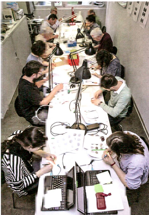
18 Die Münzen des Münzschatzes von Ueken-Zassehaldehof 2015 werden in einem Workshop des IFS (Inventar der Fundmünzen der Schweiz) bestimmt.