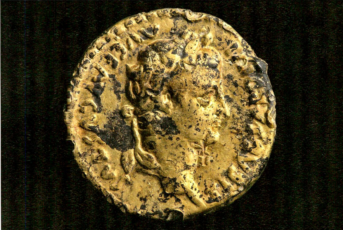
4 Windisch-Königsfelden. Aureus des Kaisers Tiberius (Avers).