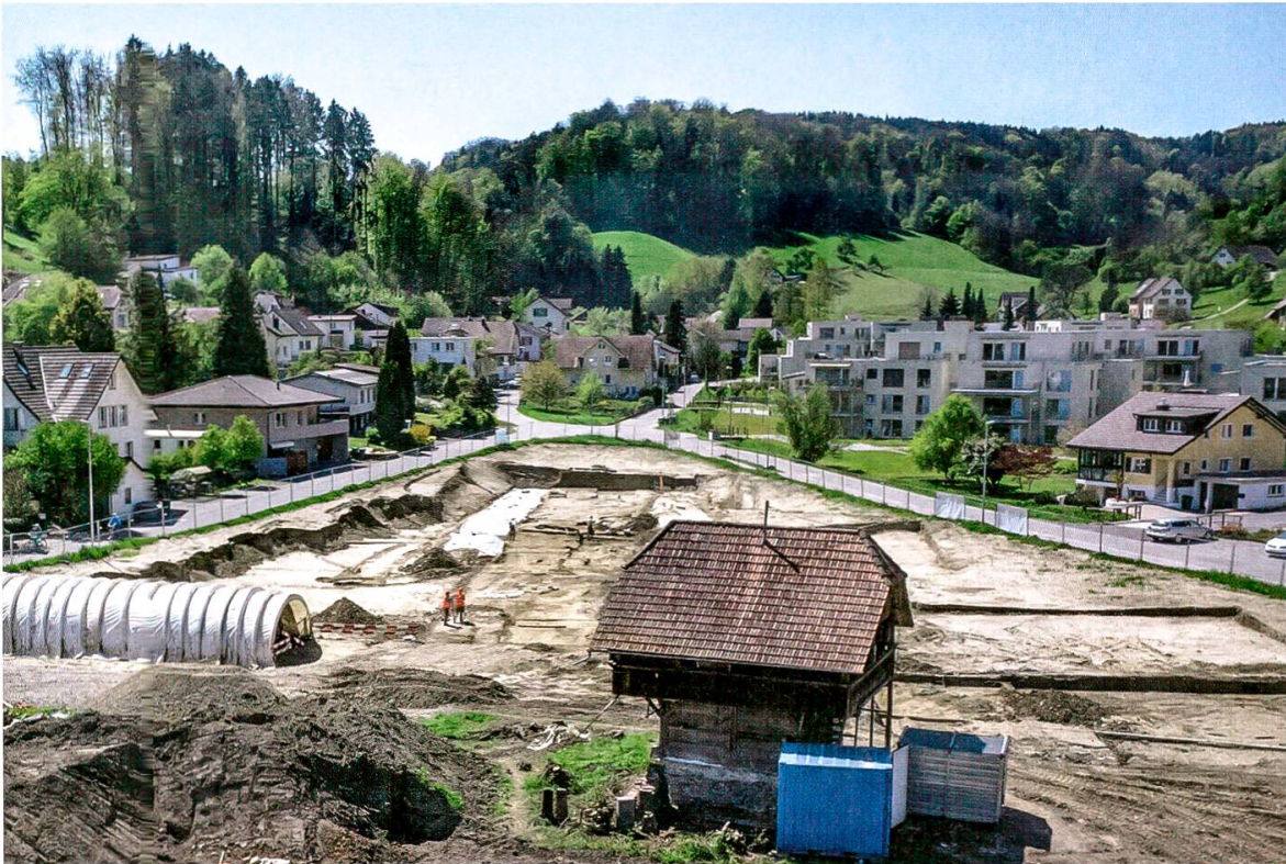
10 Gränichen-Lochgasse. Übersicht Grabungsareal Etappe 1 (2016).