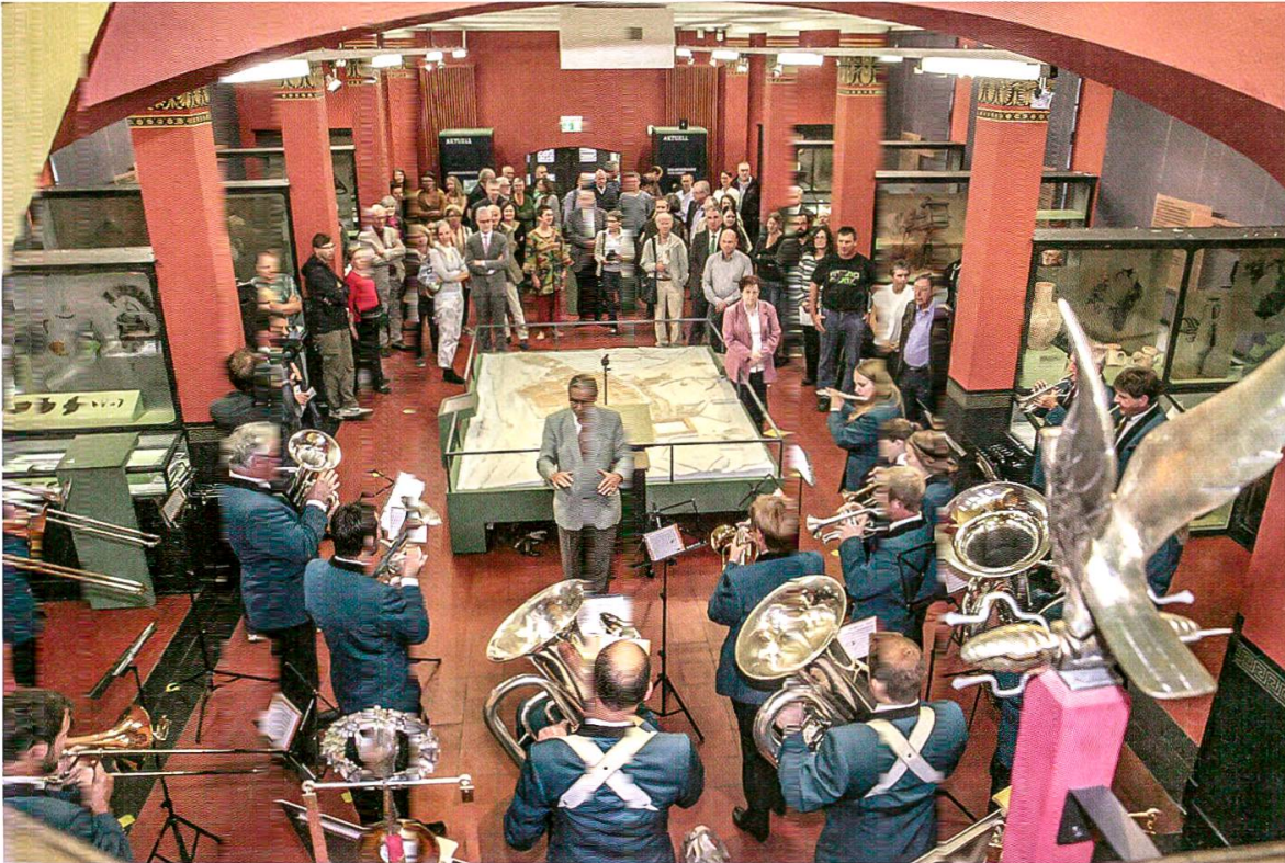
19 Vernissage der Vitrine «Aktuell» im Vindonissa-Museum in Anwesenheit von Regierungsrat Alex Hürzeler. Die Musikgesellschaft Herznach-Ueken verlieh der Eröffnung den musikalischen Rahmen. Im Hintergrund die beiden Vitrinen, in denen der Münzschatz von Ueken präsentiert wird.