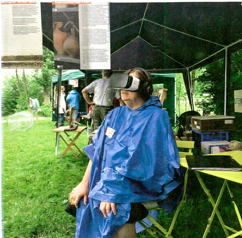
20 UNESCO-Welterbetag Beinwil am See-Aegelmoos. Neben vielen anderen Attraktionen konnten die Besucher einen virtuellen Tauchgang durch die Fundstelle Aegelmoos mittels VR-Brille absolvieren.