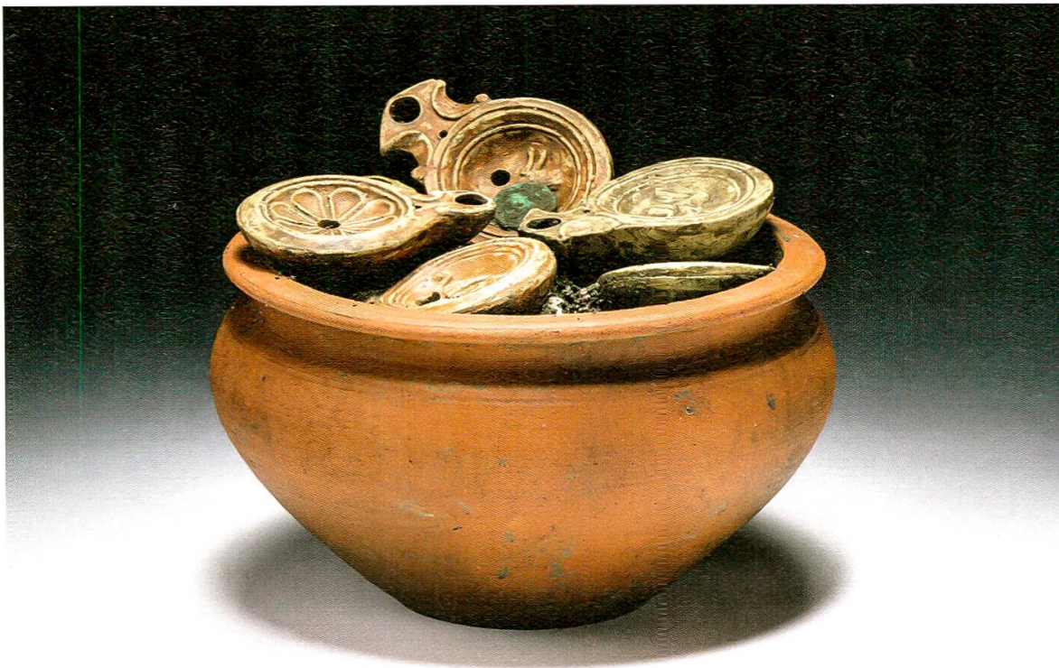
16 Kochschüssel der Grabung Windisch-Zürcherstrasse (Urech) 2016 nach der schichtweisen Freilegung im Restaurierungslabor.