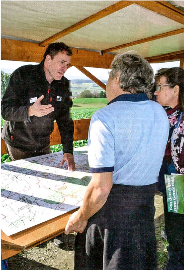
21 Geschichtstag Sarmenstorf. Auf einem Spaziergang mit acht Stationen wurden Informationen zu den archäologischen Fundstellen und Funden auf dem Gemeindegebiet sowie zum Leben in früheren Epochen vermittelt. Im Bild die Station Landschaftsarchäologie.

dete dabei Vindonissa , wo mit der Grabung Windisch-Königsfelden und Windisch-Zürcherstrasse (Urech) gleich zwei grosse und publikumswirksame Grabungen durchgeführt wurden. Erfreulich war auch der grosse Publikumsaufmarsch am Tag der offenen Grabung in Gränichen-Lochgasse am 3. Dezember 2016. Über 500 interessierte Besucher liessen sich aus erster Hand über die Befunde und Funde aus der mittelbronzezeitlichen Siedlung informieren.