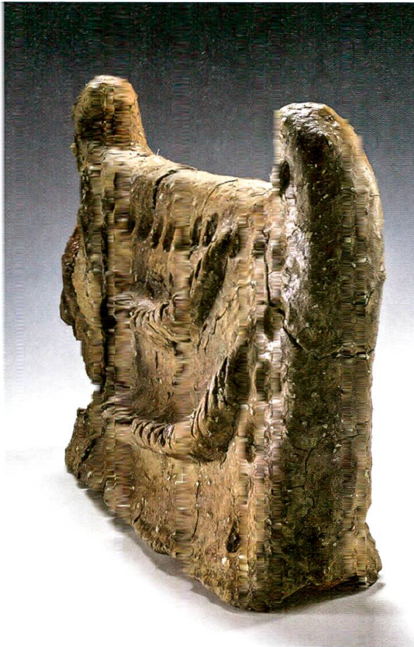
17 Im Restaurierungslabor gefestigt und zusammengesetzt: ein vollständig erhaltenes Mondhorn (Bsw.016.1/74.1).