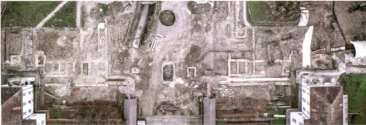
5 Windisch-Königsfelden. Übersicht über das Grabungsareal PDAG (genordet). Die Ruinen der alten Klinikflügel sind deutlich zu erkennen. Im Osten des Areals verläuft das Spitzgrabensystem.

und Annexbauten, Heizzentrale, Gaswerk, Küche) kamen im Rahmen der Ausgrabung wieder zum Vorschein (Abb. 5).