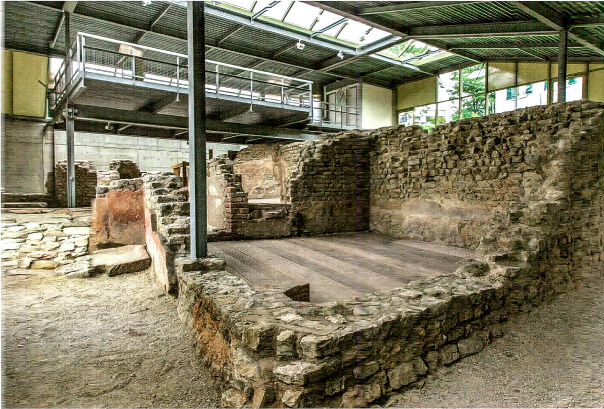
8 Kaiserougst-Schmidmatt. Ansicht des Halbkellers des sog. römischen Gewerbehauses.