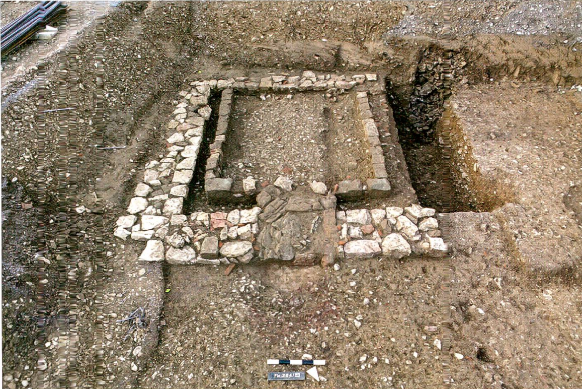
12 Frick-Obere Dorf. Blick von Norden auf den 2016 freigelegten Räucherofen und den teilweise entnommenen Mauerraubgraben.