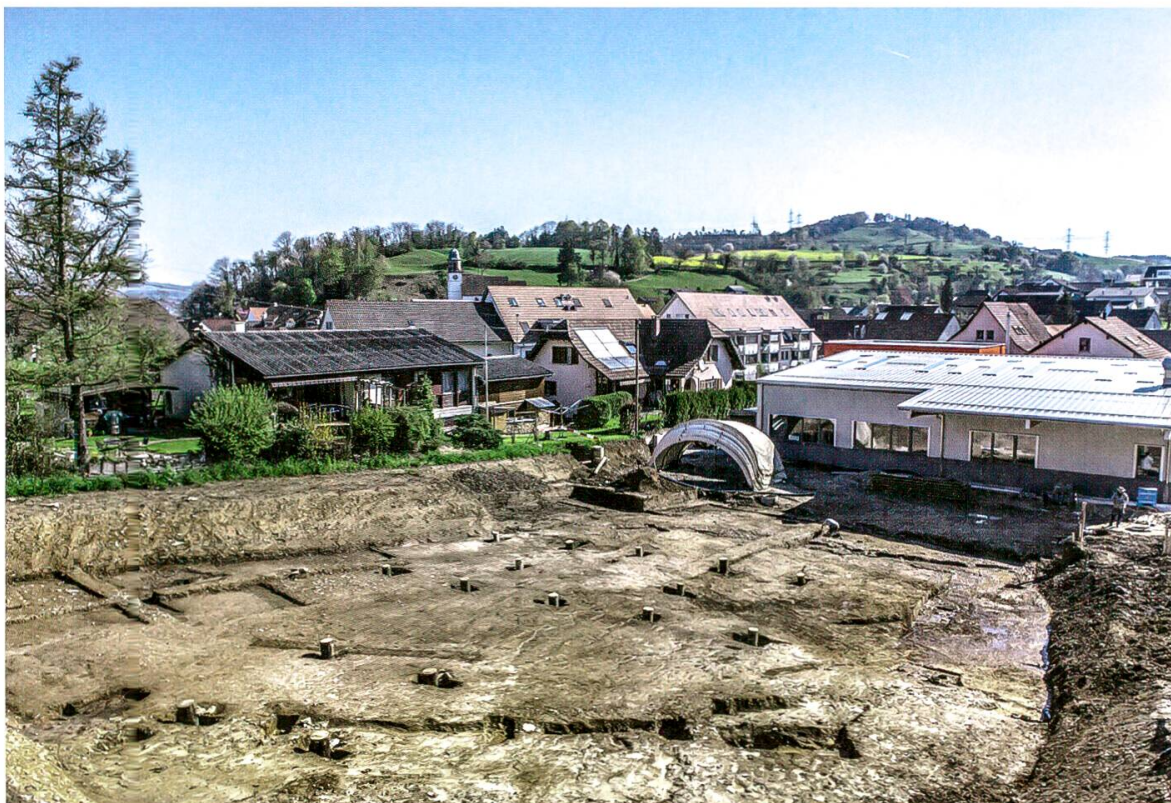
11 Kaisten-Eberimatt West. Übersicht Grabungsareal. Im Zentrum der grosse Pfostenbau.