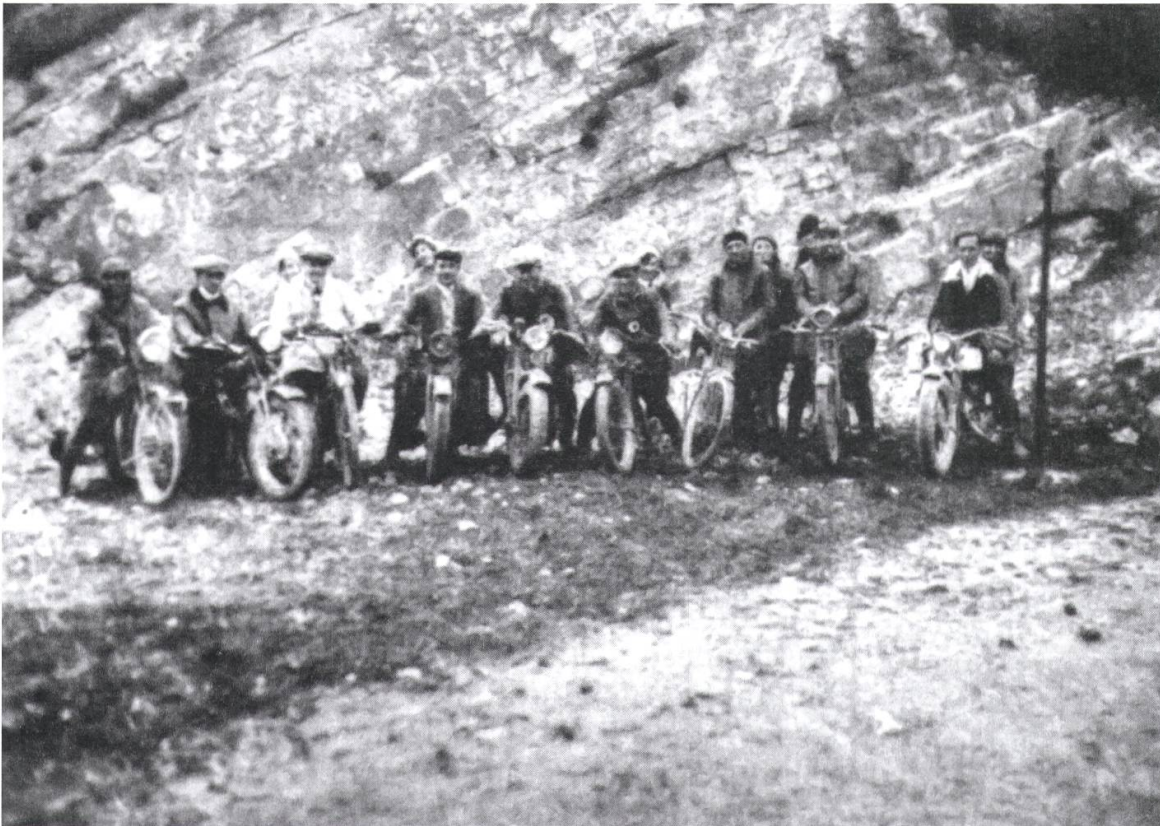
7 Neun Motorradfahrer der Sektion Aarau, manche mit Sozia, in der Taubenlochschlucht bei Biel (Arbeiter-Radfahrer vom 11. März 1932, 51).