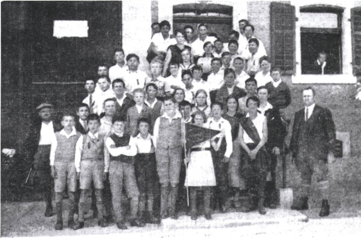
Jugend des Bezirks 10 an ihrem ersten Treffen in Brugg

9 Am verregneten Jugendtreffen von 1933 in Brugg stellten sich die Mädchen und Knaben mit dem begehrten roten Wanderwimpel am Trockenen für den Fotografen auf (Arbeiter-Touring vom 16. Juni 1933, 3).