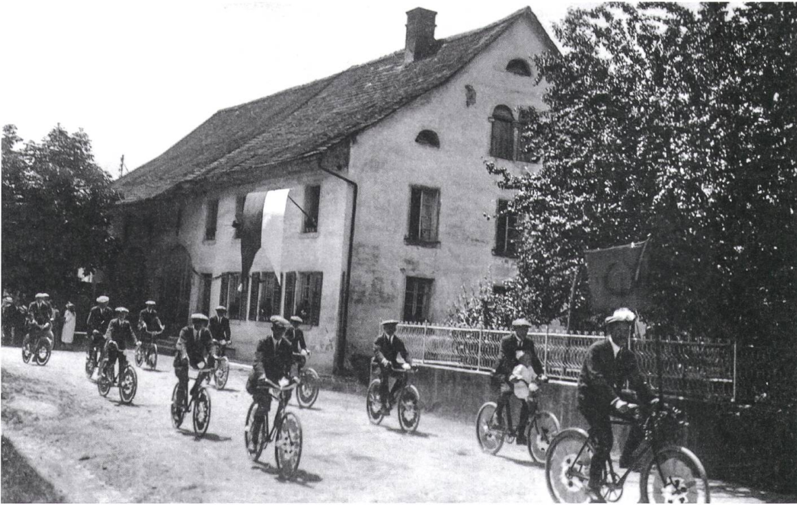
5 Die «Freien Radler» führen im Korso an der Bundesfeier 1924 in Birmenstorf mit.

ursprünglich alles junge Burschen – im Laufe der Jahre eine bürgerliche Ausrichtung erhielt und sich von der prononciert linken politischen Ausrichtung des Arbeiter-Radfahrer-Bundes immer stärker entfernte und schliesslich heimlich, still und leise als Sektion aus dem Bezirk 10 ausschied.