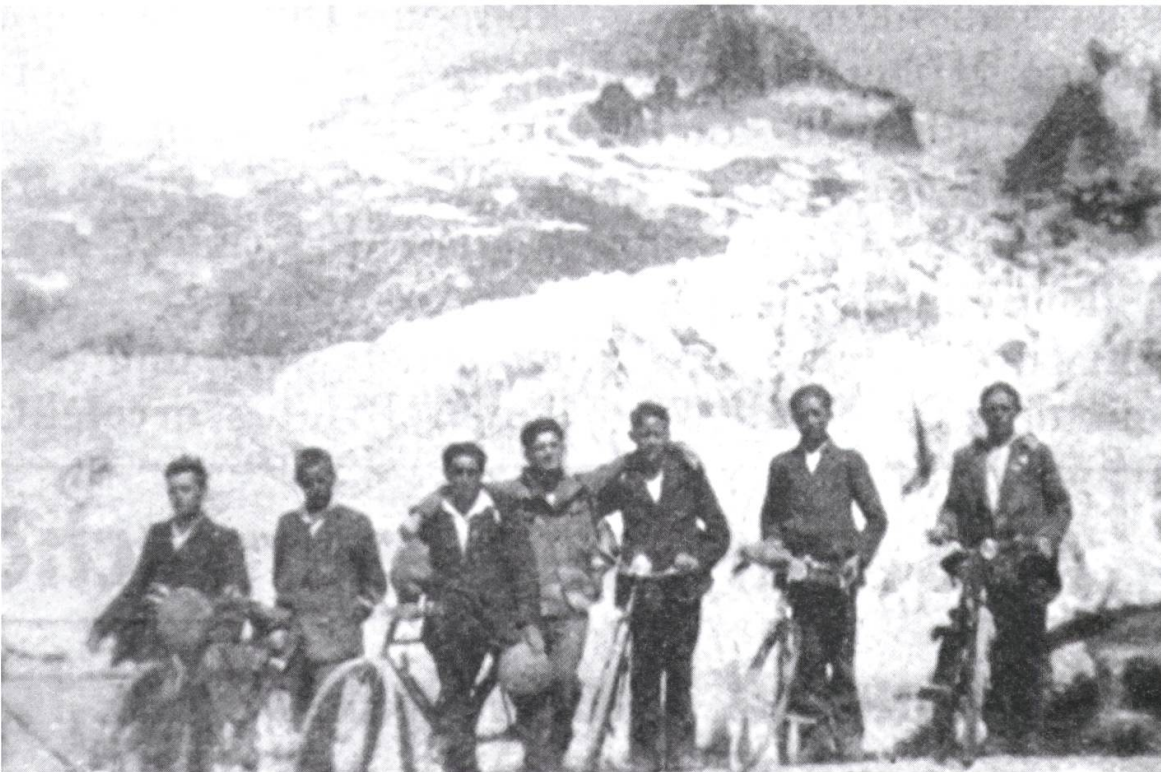
2 Die Sektion Densbüren-Asp nach dem Grimselpass bei der Rast am Rhonegletscher kurz vor der Übernachtung in Gletsch am Aufstieg zum Furkapass (Arbeiter-Radfahrer vom 10. Oktober 1930, 270).