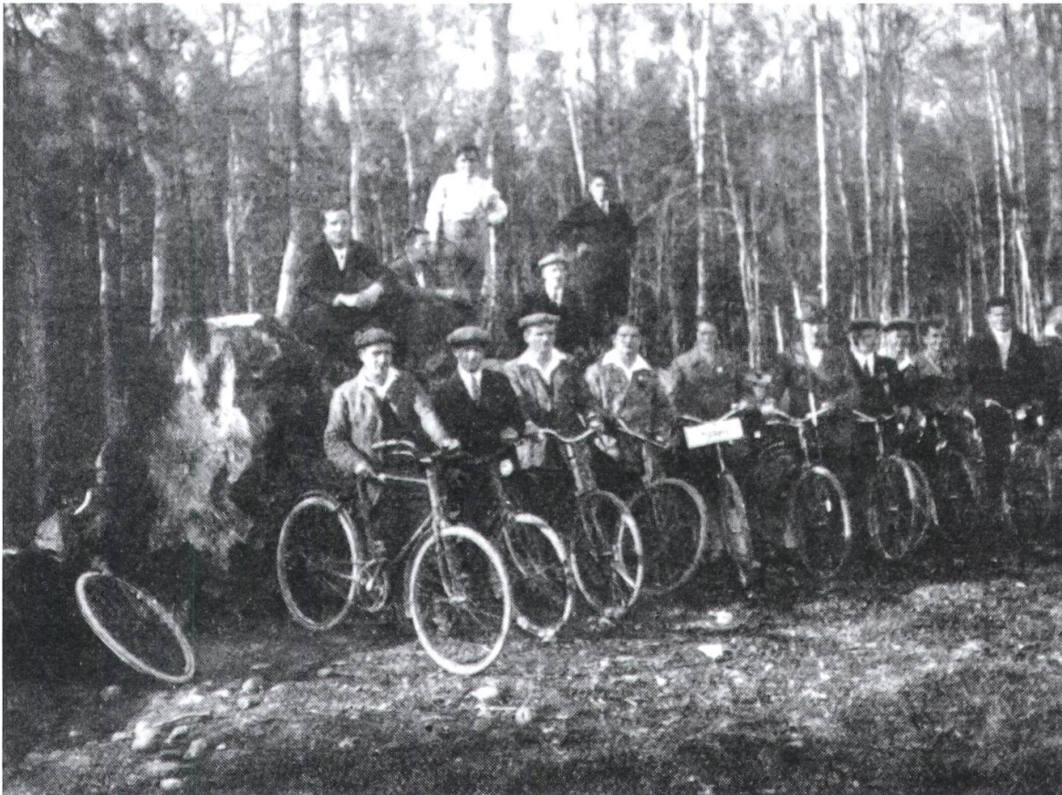
3 Männer und Frauen der Sektion Menziken in typischer Kleidung der Arbeiter-Radfahrer auf der Bezirksausfahrt nach Mellingen (Arbeiter-Radfahrer vom 21. Juni 1929, 176).

torischen, gesellschaftlichen oder drängenden aktuellen Fragen äusserten, die nicht selten eine klare politische Ausrichtung enthielten.