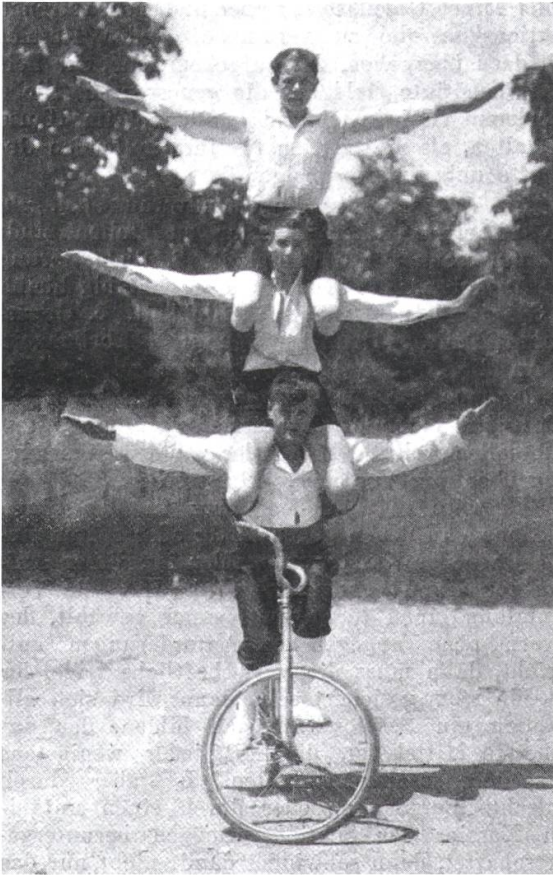
1 Drei Nachwuchssportler der Sektion Siggenthal zeigen ihr Können beim Geschicklichkeitsfahren auf einer Saalmaschine (Arbeiter-Radfahrer vom 10. Oktober 1930, 265).