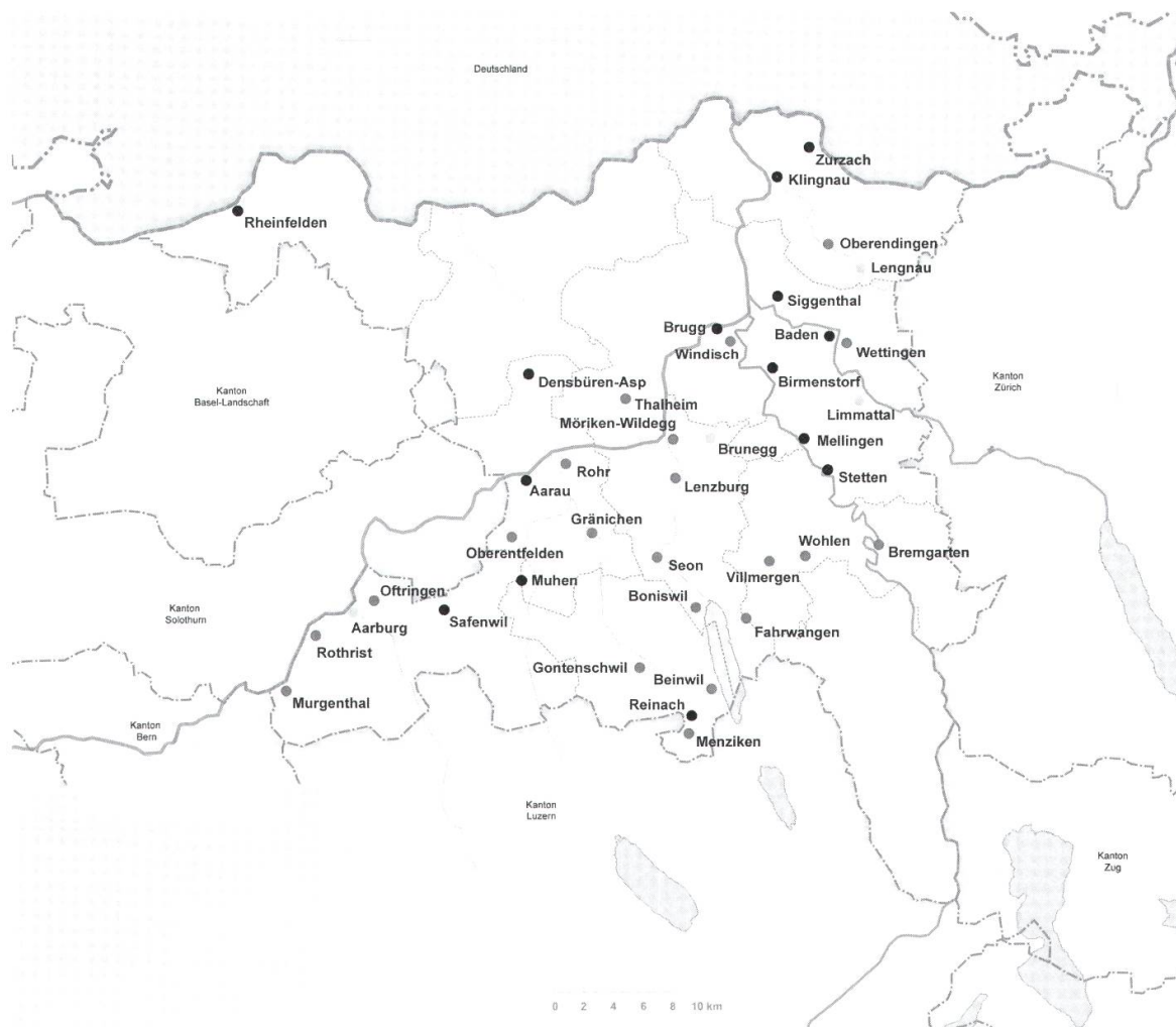
Gründungen von Sektionen: schwarz bis 1920, dunkelgrau bis 1925, hellgrau nach 1925.

und Zofingen im Westen sowie im Seetal und im Wynental lagen. Mit Bremgarten und Wohlen war auch das Freiamt vertreten, ebenso das Fricktal mit Rheinfelden. Nach 1930 entstanden nur noch in Brunegg und Möhlin neue Sektionen. 14