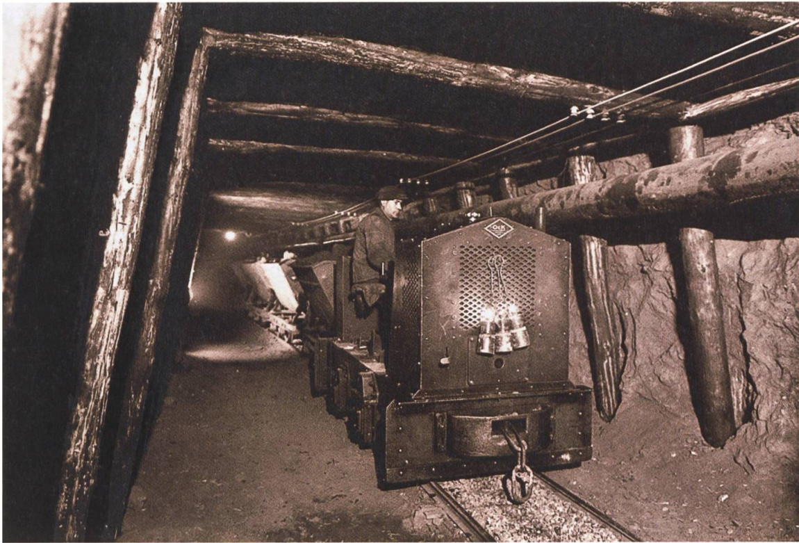
1 Die Stollen-Bahn auf einem Bild aus den 1940er-Jahren (Bild: Archiv VEB).