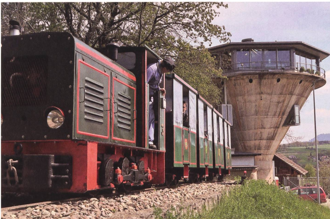
2 Das Bergwerksilo, im Jahr 1942 in Betrieb genommen, fasste einst 1000 Tonnen Eisenerz. Heute transportiert eine Lokomotive die Besucherinnen und Besucher vom Silo zum Stollen.