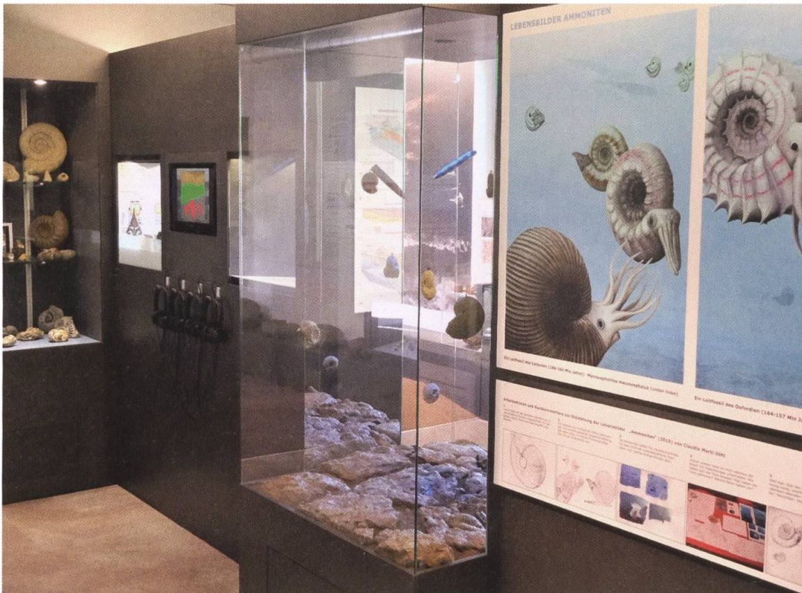
7 Blick in das kleine Museum, das einen konzentrierten Abriss über die Themen Bergwerk, Geologie und Ammoniten bietet (Foto: Geri Hirt, Linn).