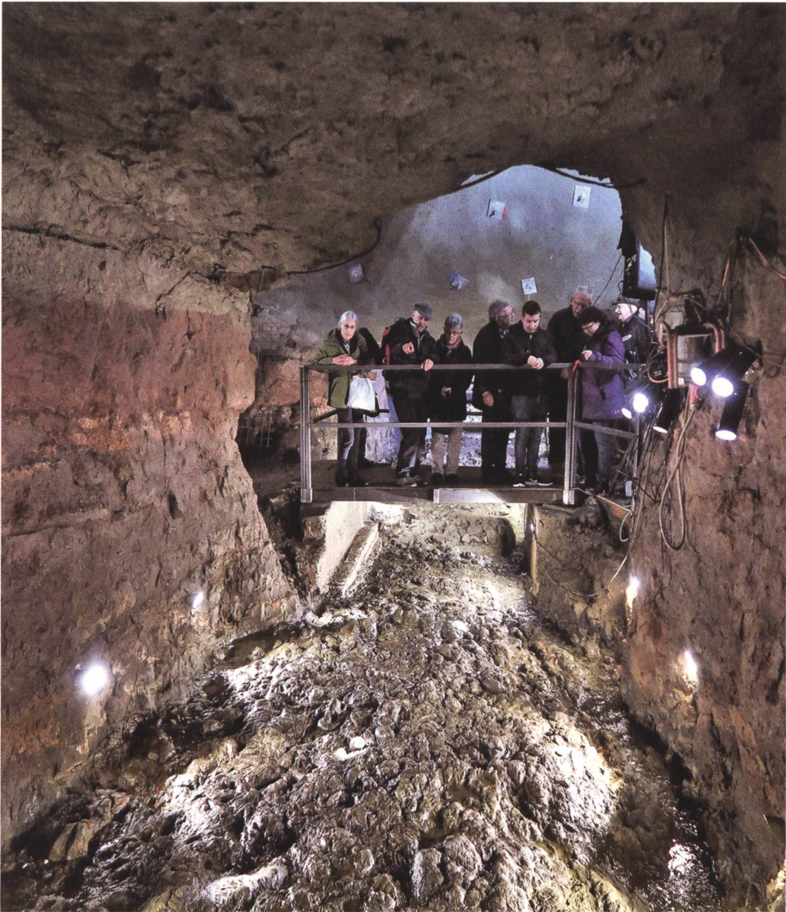
6 Der Meeresboden mit rund 165 Millionen Jahre alten Ammoniten fasziniert die Besuchenden.