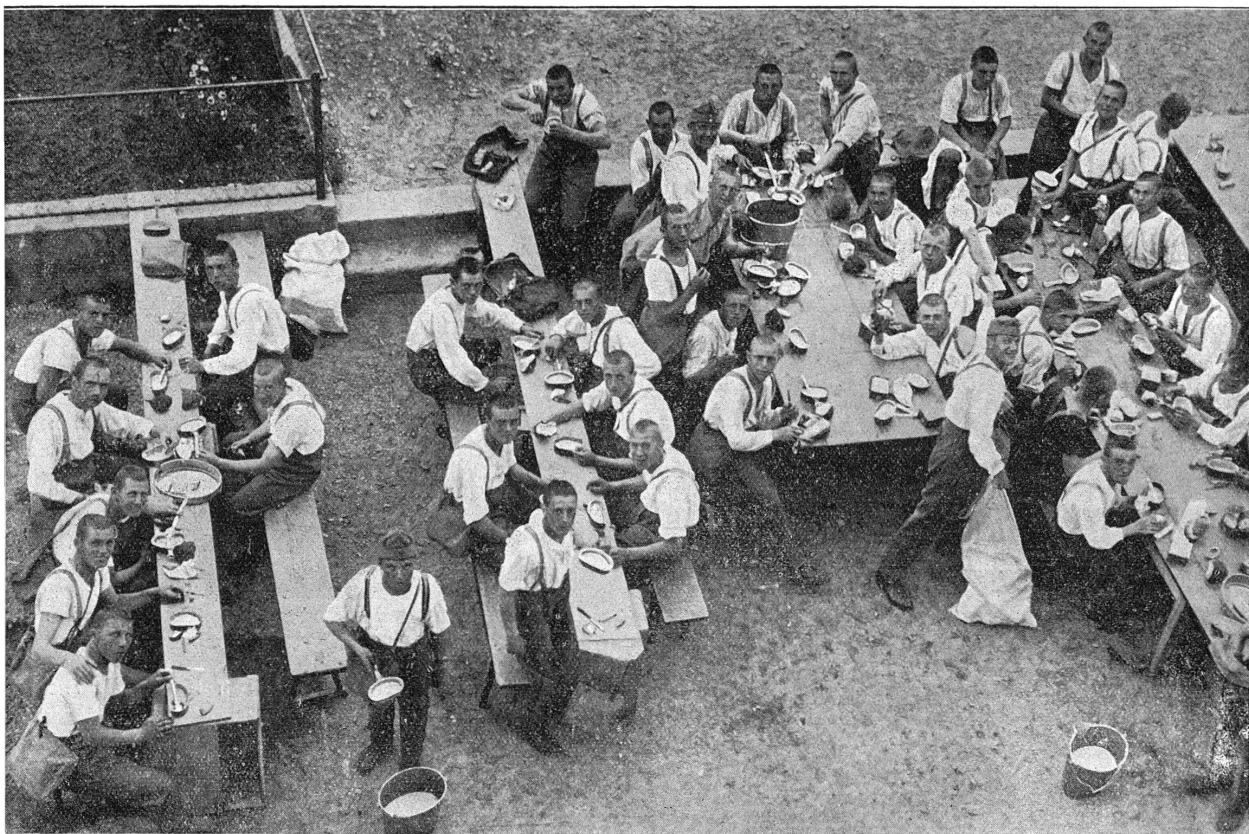
Ein erfreuliches Resultat von der Zusammenarbeit von Fourier und Küchenchef.

Bundesrat Decoppet bemühte sich als damaliger Vorsteher des Eidgen. Militärdepartements sehr für