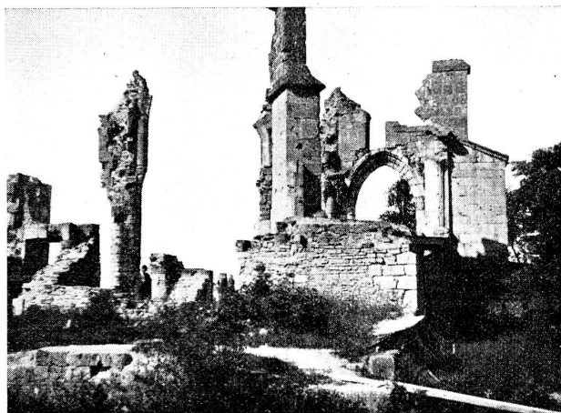
Zerschossene Kirche von Montfaucon

man vermuten, dass hier ein anderes Volk seine Toten begraben hat.