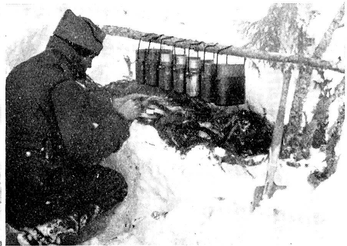
Links: Verpflegungszubereitung im Einzelkochgeschirr mittels gasförmigen Brennstoffes. — Unten: Gruppenkochstelle in einer Schneegrube; als Unterlage für das Brennholz dienen Tannenzweige. (Zensur-Nr. VI B 9585 und 9590.)

Sehr oft kommen einzelne Soldaten oder kleine Gruppen im Gebirge in die Lage, sich ihre Nahrung aus mitgeführten rohen Lebensmitteln im Einzelkochgeschirr (Gamelle) selbst zubereiten zu müssen. Hierzu haben sich die Primus-Kochapparate bisher am besten bewährt. Versuche haben ergeben, dass bei sonnigem, windstillem Wetter folgender Zeitbedarf erforderlich war, um aus Schnee eine Gamelle (2 Liter) siedendes Wasser zu erhalten: Primus-Kocher 18 Minuten, Meta-Kocher 35 Minuten.