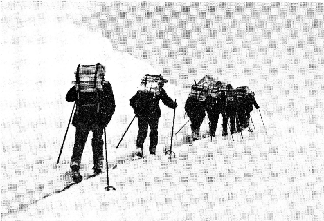
Brennholz-Nachschub durch Trägerkolonne unter dem Schutze unsichtigen Wetters. (Zensur-Nr. VI B 9693.)

eignen sie sich vorzüglich für den Transport. Dazu kommt noch, dass diese Gemüse gar keine Abfälle ergeben, sondern im vollen Gewichte ausgenützt werden können. Sie sind der Verderbnis durch Kälte und Feuchtigkeit viel weniger ausgesetzt als das Frischgemüse und bilden daher einen wertvollen Artikel für die Verpflegungsdepots. Diese wesentlichen Vorzüge überwiegen bei weitem die Nachteile einer etwas längern Kochdauer, was einen grössern Brennstoffverbrauch bedingt.