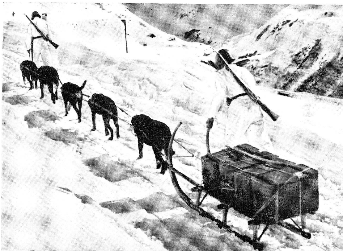
Verpflegungs-Nachschub in Kochkisten mittels Hundezug (Zens.-Nr. VI Br 899)

Neben der Brennstoff- und Wasserversorgung sowie der Kochausrüstung sind die Transport- bzw. Nachschubmöglichkeiten der Lebensmittel für die Gestaltung der Verpflegung wohl von ausschlaggebender Wichtigkeit. Auch hier haben sich die Schwierigkeiten vergrössert. Im Interesse der