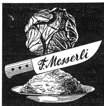
bürgt für gutes Sauerkraut

Gemäß Beschluß der Vorstandssitzung vom 25. September 1949 findet die Generalversammlung der PSS mit anschließendem Absenden Samstag, den 28. Januar 1950 im Rest. „Unteres Albisgütli“ statt. Gleichzeitig wurde beschlossen, das 25-jährige Bestehen der PSS mit einem Freundschaftsschießen und einem einfachen Jubiläumsakt zu begehen. Dieser Anlaß findet am 6./7. Mai 1950 statt. Wir bitten alle Kameraden, diese beiden Daten heute schon in ihrem Kalender 1950 zu vermerken.