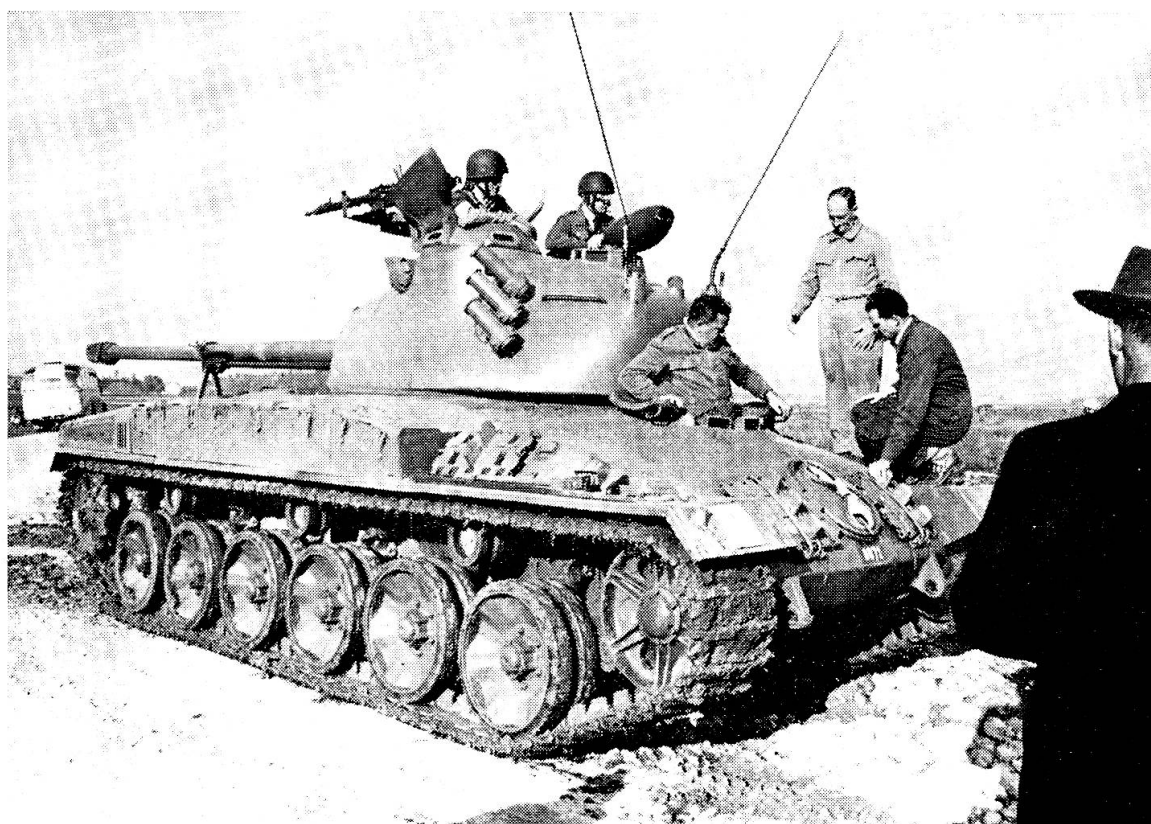
Bundesrat Chaudet als Panzerfahrer. Der Chef des EMD hat sich in Thun selbst von den guten Eigenschaften des Pz. 58 überzeugt, um sich bei einer Fahrprobe auch über die guten Lenk- und Fahreigenschaften zu vergewissern.

Diese Leistung, das hat die Vorführung auf der Thuner Allmend unter Beweis gestellt, hat diese optimistische Feststellung in allen Teilen erfüllt. Die Demonstration hinterliess bei der Presse und bei den Fachleuten einen sehr positiven und überzeugenden Eindruck. Die Eigenentwicklung von Kampffahrzeugen wurde schon während des letzten Krieges eingeleitet, als die Schwierigkeiten, aus dem Ausland geeignete Fahrzeuge zu beschaffen, offensichtlich waren. Es sind damals der NK 1 und der NK 2 begonnen worden; diese Entwicklung ist aber nie über das Stadium von Prototypen hinausgelangt. Inzwischen war es dann möglich, nach dem letzten Krieg aus der Tschechoslowakei den heute noch verwendeten Panzerjäger G 13, in Frankreich den AMX-Panzerjäger und von den Engländern den Centurion zu kaufen.