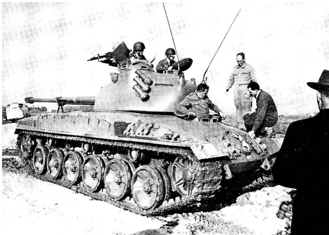
Bundesrat Chaudet als Panzerfahrer. Der Chef des EMD hat sich in Thun selbst von den guten Eigenschaften des Pz. 58 überzeugt, um sich bei einer Fahrprobe auch über die guten Lenk- und Fahreigenschaften zu vergewissern.

Diese Leistung, das hat die Vorführung auf der Thuner Allmend unter Beweis gestellt, hat diese optimistische Feststellung in allen Teilen erfüllt. Die Demonstration hinterliess bei der Presse und bei den Fachleuten einen sehr positiven und überzeugenden Eindruck. Die Eigenentwicklung von Kampffahrzeugen wurde schon während des letzten Krieges eingeleitet, als die Schwierigkeiten, aus dem Ausland geeignete Fahrzeuge zu beschaffen, offensichtlich waren. Es sind damals der NK 1 und der NK 2 begonnen worden; diese Entwicklung ist aber nie über das Stadium von Prototypen hinausgelangt. Inzwischen war es dann möglich, nach dem letzten Krieg aus der Tschechoslowakei den heute noch verwendeten Panzerjäger G 13, in Frankreich den AMX-Panzerjäger und von den Engländern den Centurion zu kaufen.