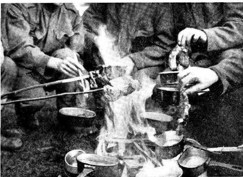
Pfadfinder- und Bubenerinnerungen tauchen auf! So schmeckt's doppelt gut!

ersetzt durch eine aussen braun und innen weiss emaillierte Feldflasche .