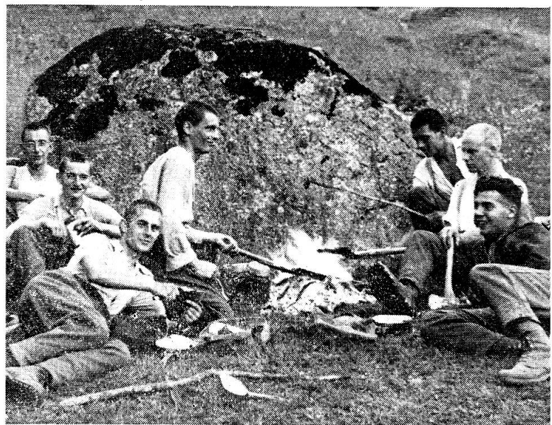
Zigeunerbraten. Das Abkochen in der Gruppe hat seine ganz besondern Reize.

Das gleiche gilt sicher auch für das Soldatenmesser . Wer kannte nicht das klobige, rostende, jedoch sehr solide Sackmesser des Soldaten. Wieviele Stunden wurden wohl diese Soldatenmesser mit Schmiergeltuch