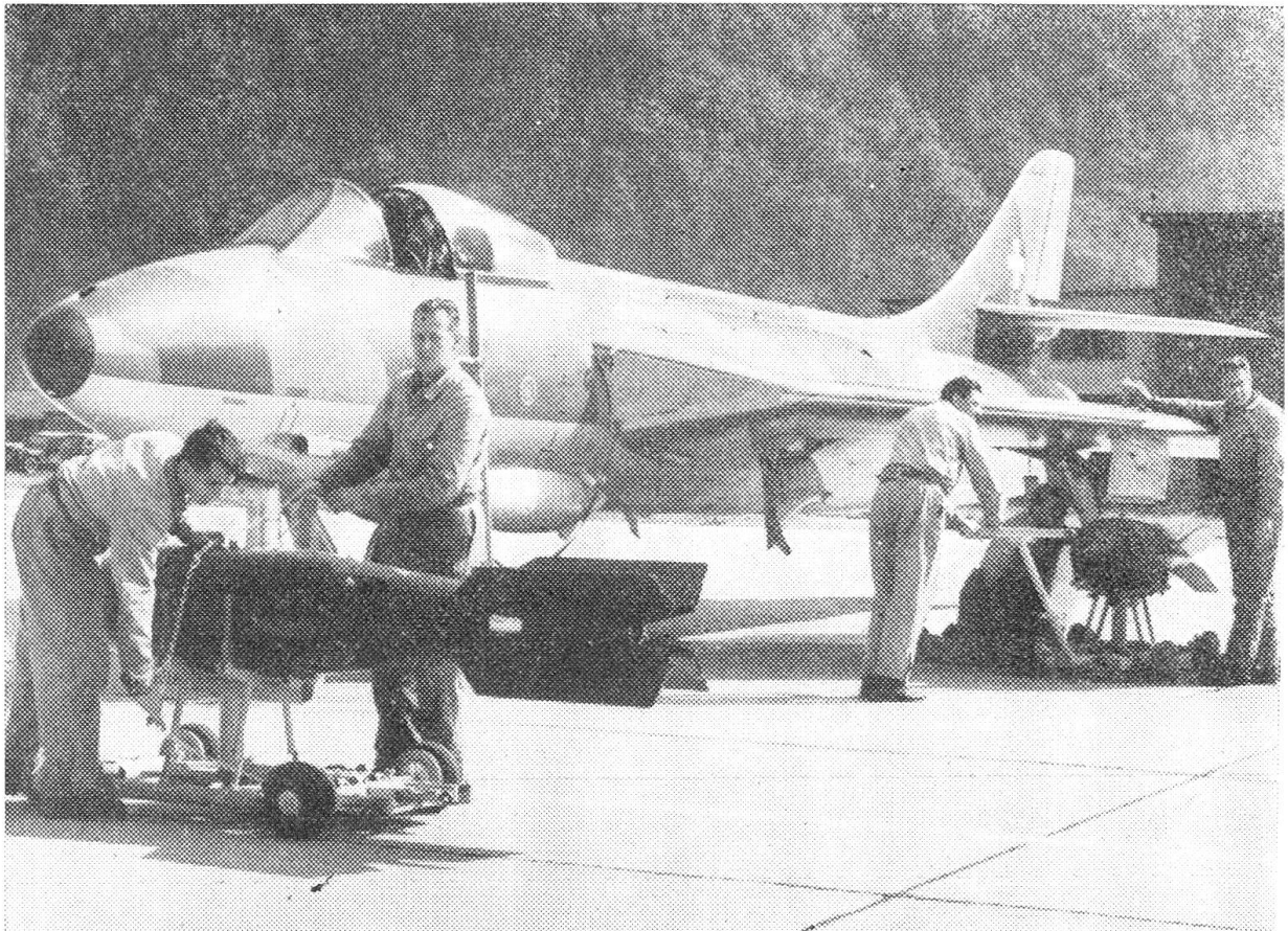
Der Hunter wird mit Bomben beladen.