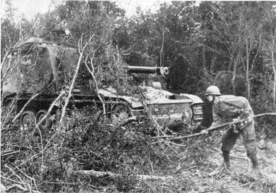
Das Selbstfahrgeschütz «Somme» ist in Stellung gefahren und wird mit Ästen schnell getarnt. Nach dem Schiessen wird die Batterie sofort ihren Standort wechseln, um dem Vormarsch der mechanisierten Truppen zu folgen und sich selbst dem gegnerischen Feuer zu entziehen.