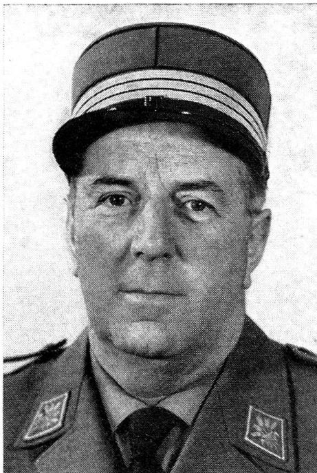
Oberst Franz Zehnder

der vom Bundesrat neugewählte Unterabteilungschef beim Oberkriegskommissariat