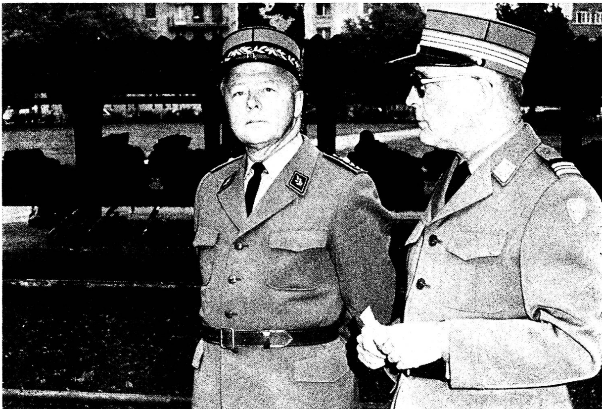
Brigadier Ehram und Oberst Kesselring freuen sich an der guten Haltung der Aspiranten beim Einmarsch in die Kaserne.

am Bielersee, über den spiegelblanken See leuchten die Lichter von La Neuveville herüber, ein Tuten verkündet die Ankunft des letzten Kursschiffes. Plötzlich ein nicht enden wollendes Trampeln über den dröhnenden Dampfschiffsteg, und durchs Dunkel der Herbstnacht huschen die Aspiranten in Kampfanzug mit Sturmgewehr. Am Ufer suchen sie sofort Deckung hinter den gepflegten Büschen des Parks.