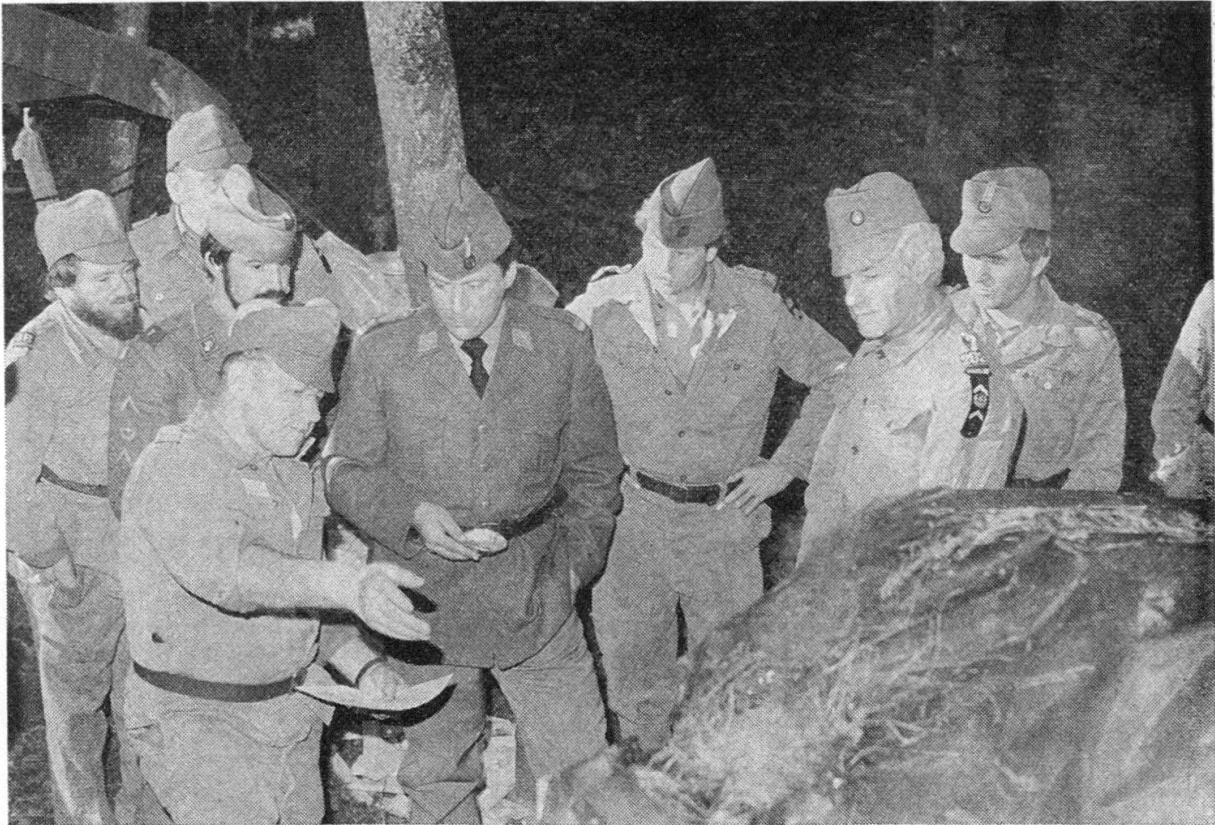
Erklären des Koreaofens