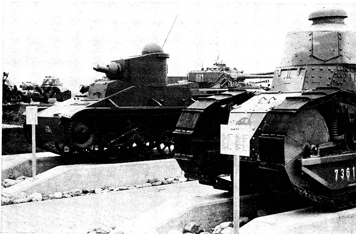
Alttester Panzer im Panzermuseum in Thun: Renault FT 17 (2 Mann Besatzung, 40 PS, 8 km/h, Schweiz)

Im Spätsommer treffen auch zwei Versuchspanzer des amerikanischen Typs M 1 Abrams ein. Vergleichende Versuche zwischen dem deutschen und dem amerikanischen Kampfpanzer ab Herbst dieses Jahres sollen zeigen, welcher der beiden Konkurrenten die Anforderungen der Schweizer Armee am besten erfüllen könnte.