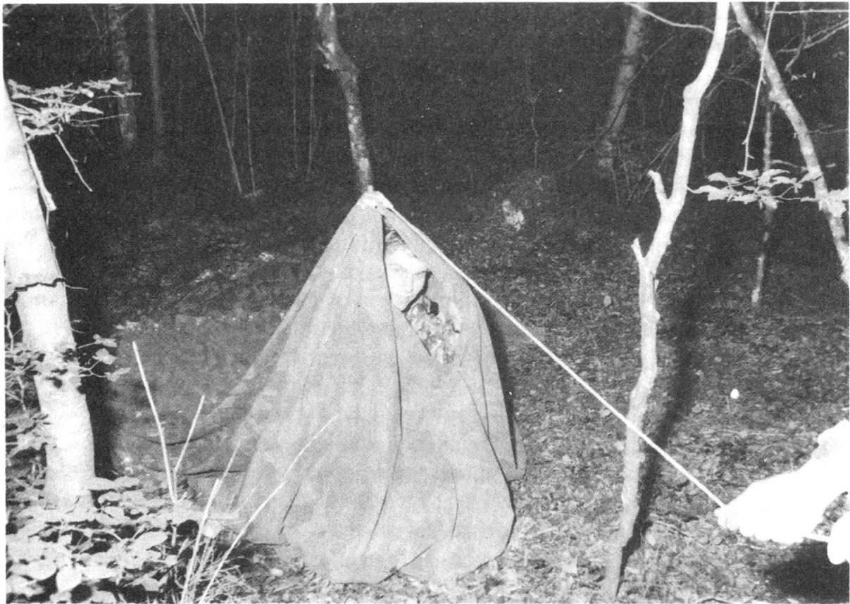
Fourierschüler beim Zeltbau ...