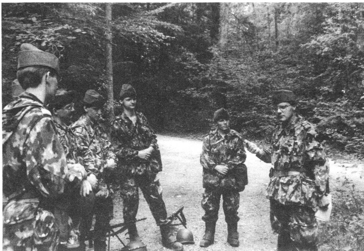
Gruppenchef bei der theoretischen Gefechtsausbildung

Um 18.00 Uhr erhielten wir die Zwischenverpflegung für den noch bevorstehenden 12 km Marsch. Auf den Landjäger und die Schokolade hatte ich bei der herrschenden Hitze nicht sonderlich Appetit. Zwischen 18.00 und 18.30 Uhr traf ich noch die letzten Marschvorbereitungen. Schuhe nachbinden. Helm in der Kapuze verstauen, Feldflasche mit Tee nachfüllen und was ganz wichtig ist, Studium der Marschrouten. Das Marschieren bereitete mir keine Mühe, denn als Infanterist war ich auf solche Übungen genügend vorbereitet. Was mir eher zu schaffen machte, war die Hitze. Trotzdem erreichte unsere Patrouille das Ziel innerhalb der limitierten Zeit von 2 Stunden und 30 Minuten. Vor dem Zubettgehen hatte unser «Sanitäter» alle Hände voll zu