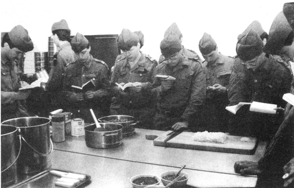
Andächtig ... beim Nachlesen des Rezeptes zur Zubereitung von Geschnetzeltem

Nach der Befehlsausgabe verschoben wir uns über die Thuner Allmend (über die Panzerpiste) in Richtung Auwald zum