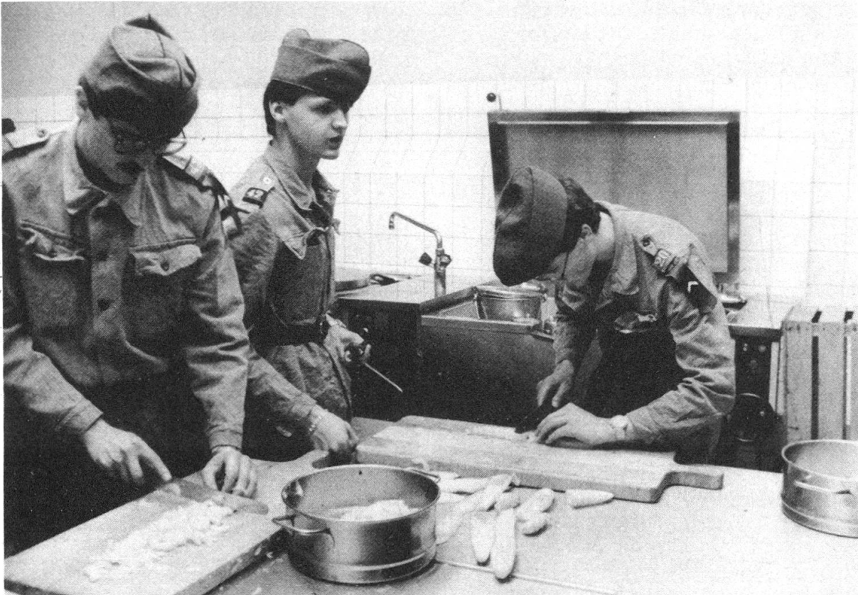
Gurkenschnitten im Akkord bereitet einem Anfänger zunächst Schwierigkeiten!

tun, um die kleineren und grösseren Blasen zu behandeln. Wir machten uns schon darüber Gedanken, ob wir wohl in der ersten Stunde des nächsten Tages gleich spritzig aufstehen würden auf den Befehl «Auf» beim Melden der Klasse!»