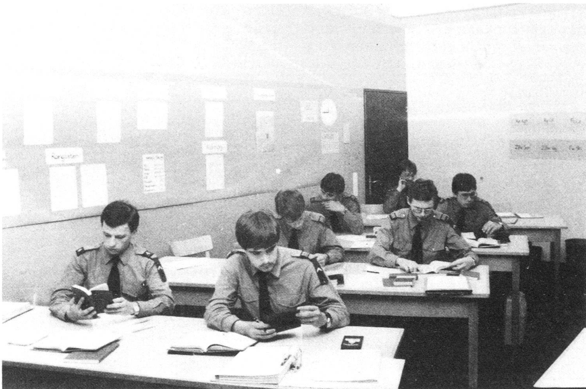
Beim Suchen... der entsprechenden Hinweise in der Fourieranleitung mit Ausschnitt der KP-Möblierung an den Wänden.

Buchhaltungs- und Verwaltungsdienst ist in der Fourierschule gross geschrieben. Seit diesem Jahr werden die Fourierschüler nur noch mit der Truppenbuchhaltung «TRUBU» ausgebildet. Wer kennt sie nicht – die Füs Stabskp 33! Der WK der Füs Stabskp 33 wird mittels eines neuen Drehbuches den Fourierschülern vermittelt und auch erarbeitet. Jedem Fourierschüler seine Schreibmaschine! Auch wenn die neue Truppenbuchhaltung «TRUBU» von Hand geschrieben werden kann, schreibt der Fourierschüler aus ausbildungstechnischen Gründen die Belege mit der Schreibmaschine. Manch einer wird nach Absolvierung der Fourierschule zuhause froh sein, dass er das Maschinenschreiben in der Fourierschule erlernt hat.