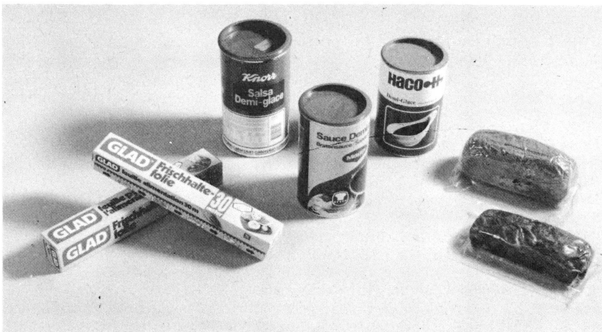
Frischhaltefolie, Bratensauce, Frischhaltebrot, Früchtebrot

Hier werden künftighin Pakete zu je 250 g = 4 l Kaffee in Sammelpackungen von 20 Paketen abgegeben. Die neue Menge entspricht dem Normalgewicht ziviler Abfüllanlagen