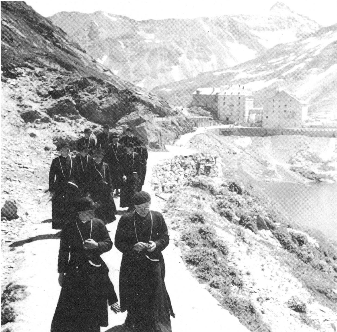
Hospiz des Grossen St. Bernhard-Passes

Unter strengster Geheimhaltung, um die Oesterreicher so lange wie möglich über seine Pläne im Ungewissen zu lassen, fiel Napoleon mit seiner Reservearmee von Dijon in Italien ein. Mit 5 Kolonnen überquerte er die Alpenpässe. Das Schwergewicht lag auf dem Grossen Sankt Bernhard, der am 20. Mai 1800 überquert wurde; Nebenaktionen erfolgten über den Mont Cenis, den Kleinen Sankt Bernhard, den Gotthard und den Simplon. Von den Oesterreichern unbemerkt, vereinigte er seine Kräfte jenseits der Alpen und schlug die mit dem Rücken gegen die Alpen stehenden und schlecht gesicherten Oesterreicher in der dramatischen Schlacht vom 18. Juni 1800 bei Marengo. Er selber marschierte über den Grossen Sankt Bernhard. Die hier vorgehende Truppe erhielt zur Täuschung die Bezeichnung «Armée Berthier», in Wirklichkeit kommandierte er jedoch selber.