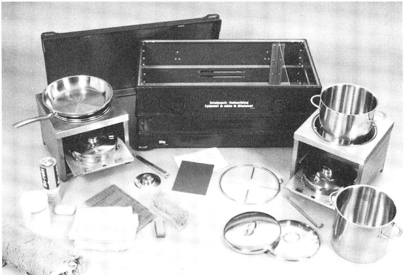
Detachementskochausrüstung in Auslegeordnung.