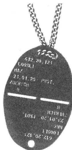
Oben: Die zweiteilige Erkennungsmarke Nebenstehend: Militärische Identitätskarte