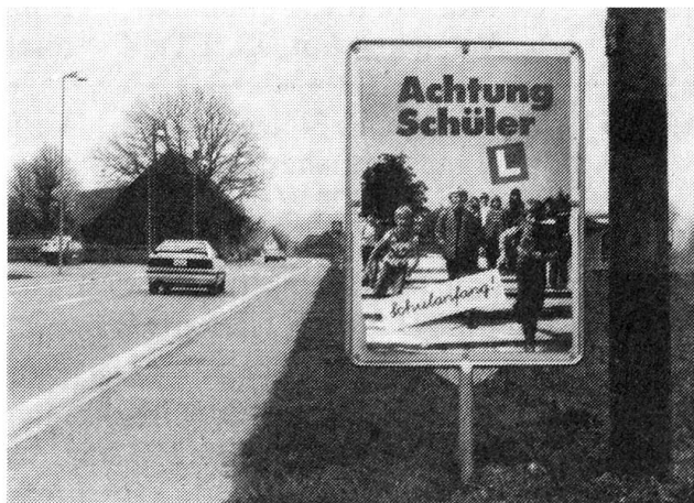
Aktionsplakat zum Schulanfang.

Heute beschäftigt die bfu rund 50 Vollprofis, worunter Ingenieure, Psychologen, Juristen und Lehrer. Über das ganze Land verteilt setzen sich seit 1973 zahlreiche, durch die Gemeinde gewählte, Sicherheitsdelegierte (heutiger Stand ca. 1'200) für die bfu-Ziele ein. Sie fördern auf lokaler Ebene die praktische Sicherheitsarbeit und führen ihre Tätigkeit ehrenamtlich aus.