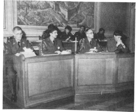
Die Zentraltechnische Kommission an der DV