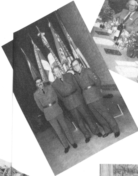
Illustre Gäste beim Bankett