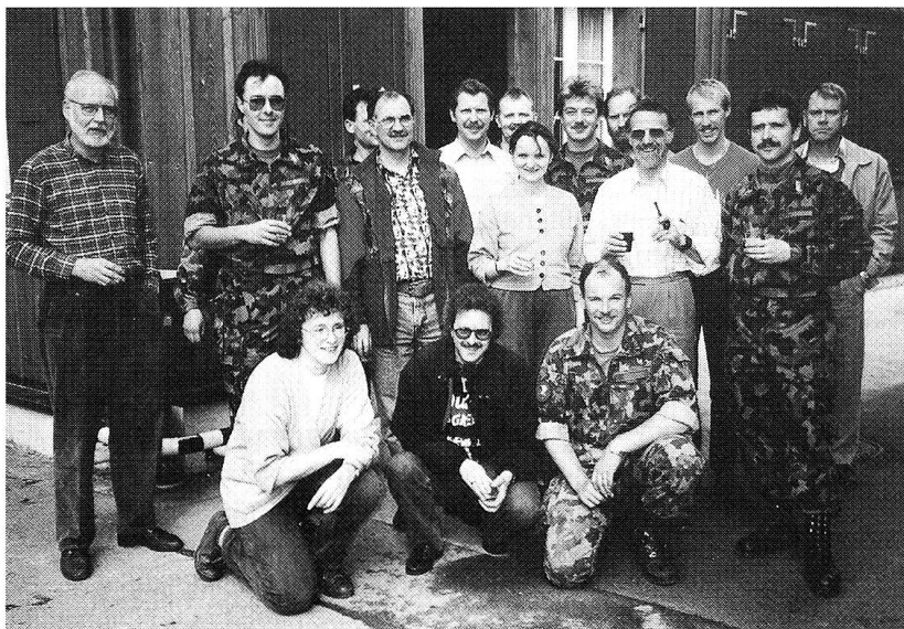
Legende zu Bild: Mitglieder MFD-Verband, Fw-Verband, VSMK und Four-Verband am gemeinsamen Ausbildungstag im St. Galler Breitfeld.

erfolgte die anschliessende Ausbildung im Rahmen von Postenarbeiten. Als Themen wurden die neue HG, der neue AC-Schutzanzug, San Dienst sowie Hygiene und Sicherheitsvorschriften beim Betrieb des Benzinvergaserbrenners behandelt. Unterbrochen wurde unser Ausbildungstag durch ein Mittagessen vom Grill mit Salatbuffet. Als kleine Belohnung für ihr Interesse erhielten die Teilnehmer am Ende des Ausbildungstages einen kleinen Apéritif.