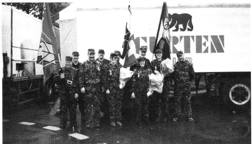
Durchnässt, aber stolz auf die erbrachte Leistung: St. Galler Fouriere und Küchenchefs am Berner Zweitagemarsch

Auch wenn man es kaum glauben kann, die Stimmung – nicht nur bei uns – liess sich vom Wetter nicht anstecken. Bei uns allen lautet das Motto: «Also dann, bis zum nächsten Jahr!» Und wie wäre es, wenn auch du dich uns anschliessen würdest?