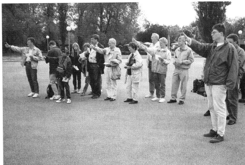
Wie weit ist's bis zum deutschen Ufer?

Dieses Jahr setzten wir ganz auf den öffentlichen Verkehr. Mit der «Thurgauer Tageskarte» ging's ab Frauenfeld bzw. Weinfelden per Bahn nach Ro-