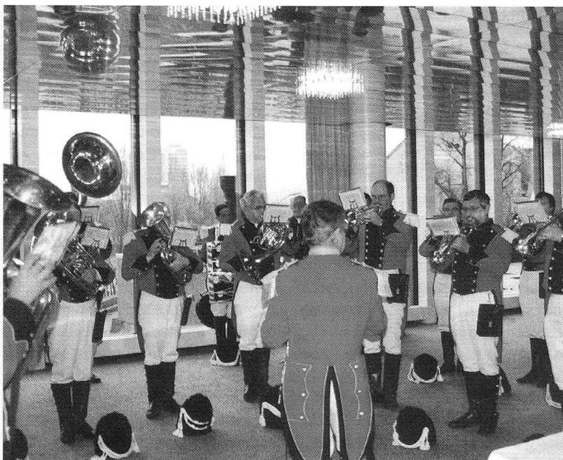
Die Grenadiermusik umrahmte den Jubiläumsakt.