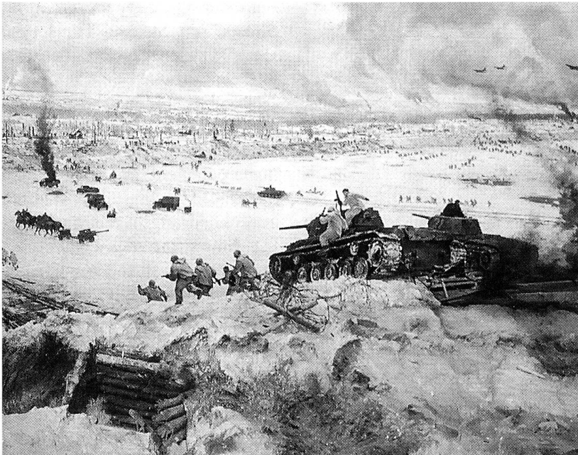
Unser Bild aus dem Museum in Petersburg zeigt eindrücklich: «Kämpfe zum Durchbruch».

Hitler befahl, Leningrad nicht gewaltsam zu erobern, sondern auszuhungern. Leningrad war mit seinen drei Millionen Einwohnern die zweitgrößte Stadt Russlands. Ihre Lebensmittelvorräte reichten ungefähr für einen Monat. Schon im Oktober 1941 setzte Hungersnot ein, und im November starben bereits 11 000 Menschen. Im Dezember stieg die Zahl der Hungertoten auf 1500 je Tag an. Doch ihre 100 000 Verteidiger wehrten sich hartnäckig, und ihre Fabriken setzten ihre Produktion von Kriegsmaterial ungehindert fort.