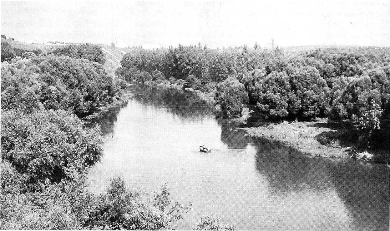
Hier in Kursk, in dieser herrlichen Gegend, fand die grösste Panzerschlacht der Weltgeschichte statt.