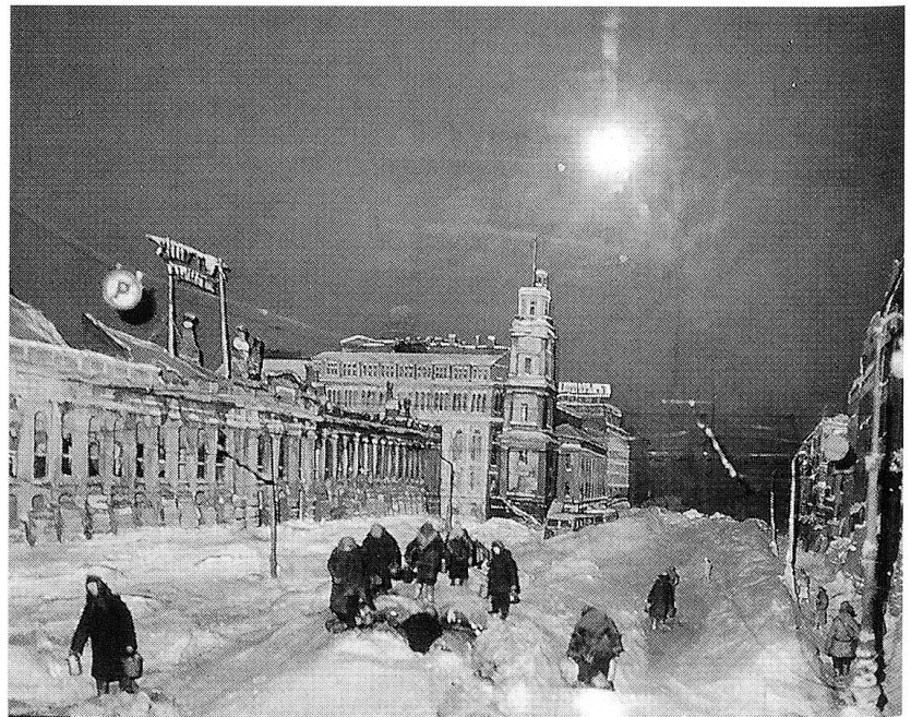
Die Millionenstadt Leningrad, 1703 von Peter dem Grossen als «Fenster zum Westen» nach einem einheitlichen Plan angelegt, während den 900 Tagen Widerstand gegen die Deutschen.

Zur gleichen Zeit begann beidseits von Moskau eine grossangelegte russische Gegenoffensive mit frischen, aus Sibirien herangeholten Kräften. Die Deutschen mussten geschwächt durch Kälte und Entbehrungen, ihre vordersten Positionen räumen.