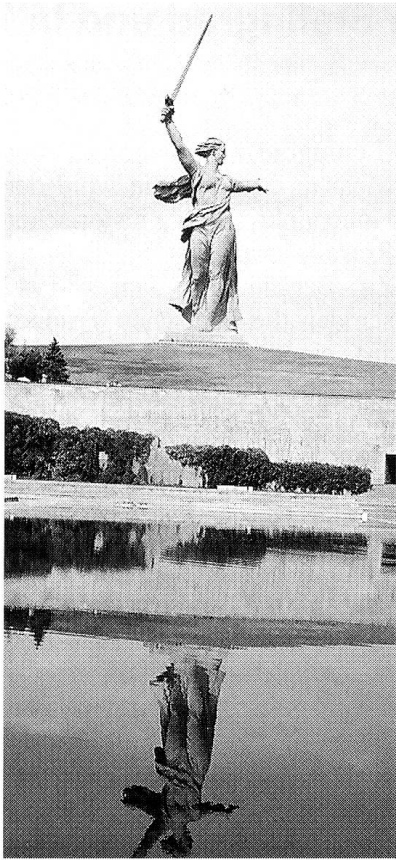
Das imposante «Frauendenkmal» im heutigen Stalingrad.