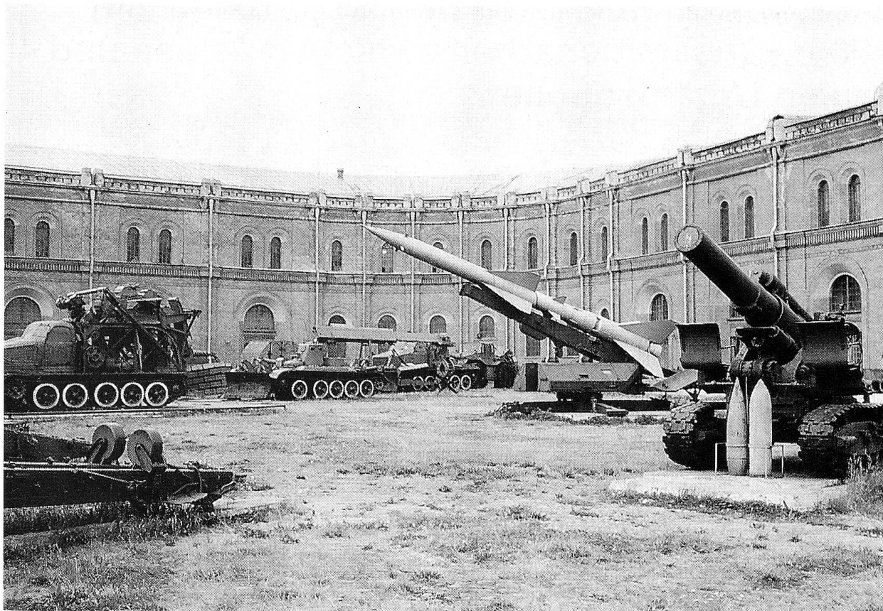
Das Artillerie-Museum, Lenin-Park, im Kronweg der Peter- und Pauls-Festung. Nach seinem Sieg über die Schweden legte Peter der Grosse 1703 eigenhändig den Grundstein für diesen gewaltigen Festungsbau. Seit der Jahrhundertwende wurden in dem Bau nur noch politische Gefangene untergebracht.

Doch warum sollte man nicht nach weniger Bekanntem greifen, zum Beispiel «Schtschi», der Seniorin unter den Suppen? Seit über hundert Jahren kommt sie zu jeder Jahreszeit auf den Tisch. Hauptbestandteil ist frischer oder gesäuerter Weisskohl, verfeinert durch Sauerampfer, Brennesseln, grüne Äpfel, Pilze sowie verschiedene Kräuter und Gewürze. Die kräftige Brühe liefern Rind- oder Schweinefleisch.