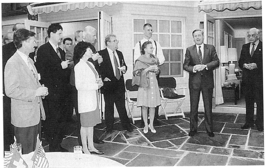
Die Reisegesellschaft im Garten der Villa von Div Schlup.

Bericht über die USA-Reise des Schweizerischen Fourierverbandes (SFV) und der Offiziersgesellschaft (OG) vom 29. September bis 8. Oktober 1995