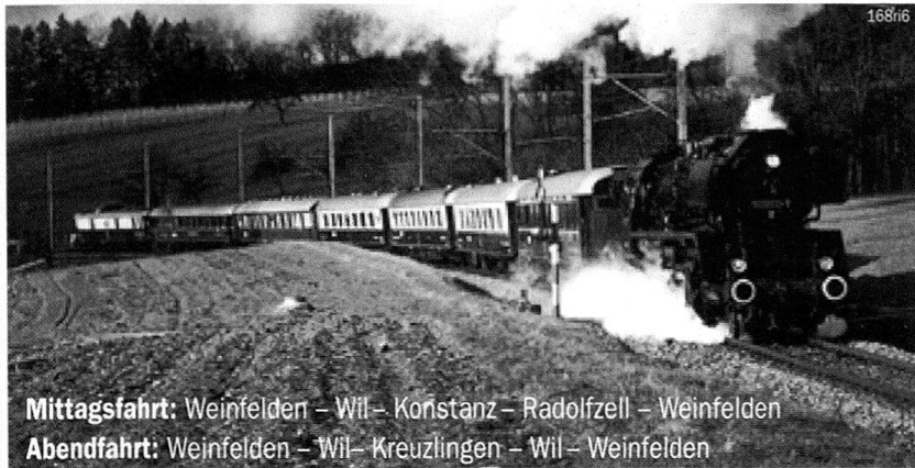
Mittagsfahrt: Weinfelden – Wil – Konstanz – Radolfzell – Weinfelden Abendfahrt: Weinfelden – Wil – Kreuzlingen – Wil – Weinfelden