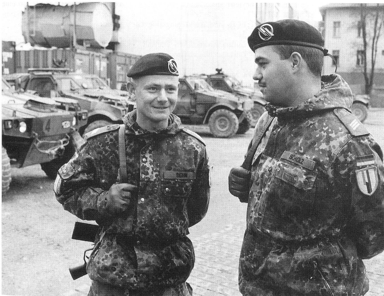
Zwei deutsche Soldaten der deutsch/französischen Brigade.

Von Hartmut Schauer (Text)