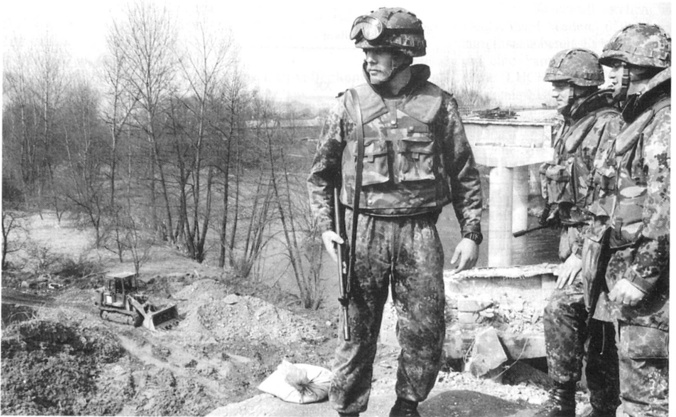
Soldaten des Pionierbataillons GECONIFOR (L) reparieren die schwer beschädigte Brücke über die Bosna bei der Ortschaft Visoko, welche rund 20 km nordwestlich von Sarajewo liegt. Im Bild: Pioniere auf der Auffahrt zur Brücke. Im Hintergrund die zerstörte Brücke.

panzer LEOPARD 2 verzichtet, da man Provokationen und Skatationen unbedingt vermeiden möchte. So musste ein Teil der Panzerbesatzungen des Panzeraufklärungsbataillons 12 extra auf den leichten Radpanzer LUCHS umgeschult werden.