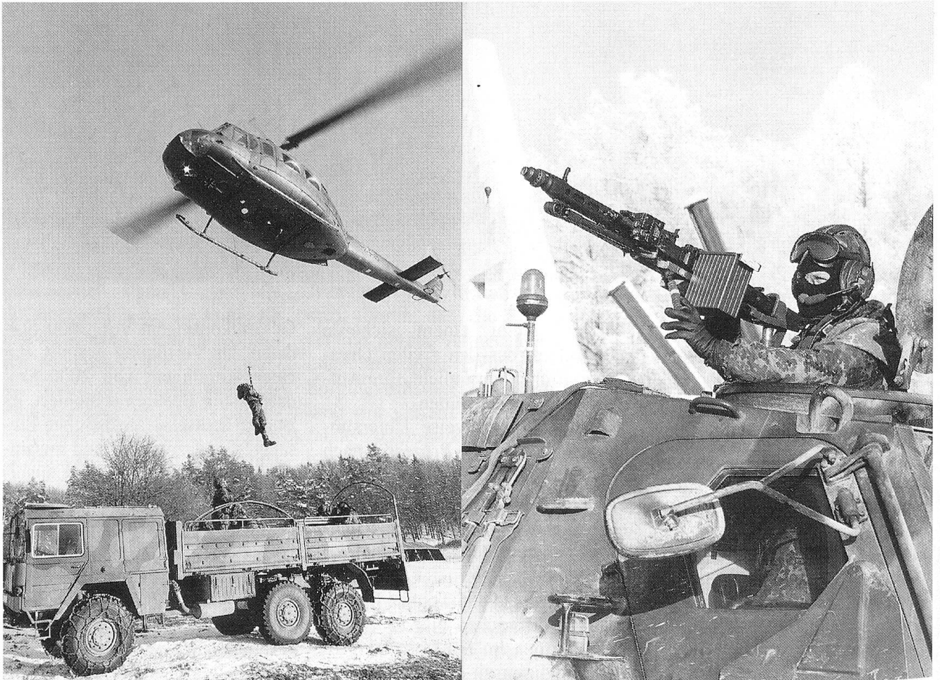
Das Bergen eines Verletzten mittels Hubschrauber aus einem verminten Gebiet wird geübt (links). Rechts: SFOR-Soldat am MG