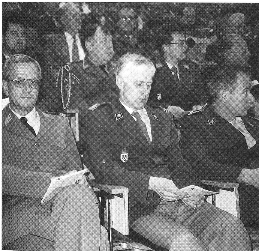
Wohin sich auch all' diese Blicke richten: Der Schweizerische Fourierverband will auch in Zukunft als moderne Institution der Hellgrünen wirken.

WINTERTHUR - Über 200 Delegierte, Ehrenmitglieder und Gäste erlebten am Samstag, 12. April, im «Technorama» anlässlich der 79. Delegiertenversammlung des Schweizerischen Fourierverbandes (SFV) ein eindrückliches Stelldichein des Gradverbandes.