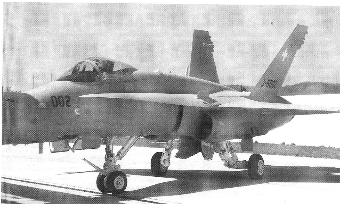
Der erste Einsitzer F/A-18 unserer Luftwaffe.