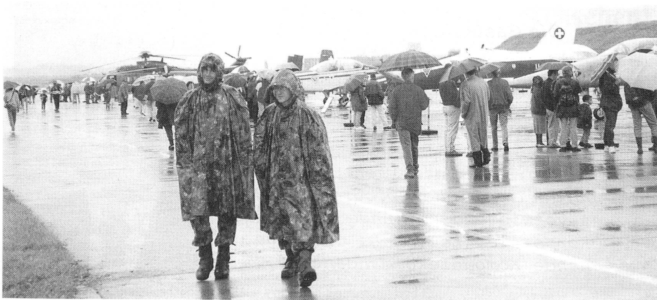
Während des eigentlichen Wettkampftages, am Freitag, 12. September, herrschte in Emmen ideales Wetter. Umso ergiebiger schüttete es am darauffolgenden Samstag, als nur wenige Zuschauer die Flugzeuge am Boden bestaunten.