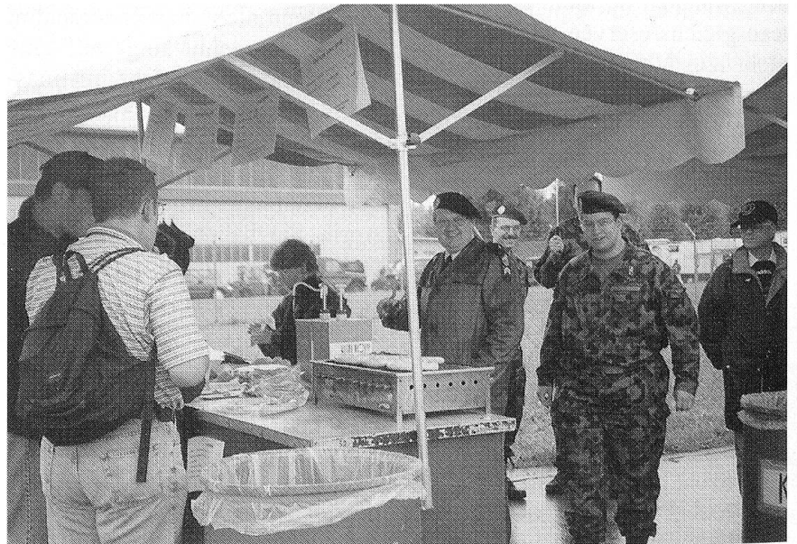
Trotz Wetterpechs und geringer Nachfrage nach dunklen und weissen Bratwürsten sowie Servelats liessen sich die Helfer am Stand der Sektion Zentralschweiz die Laune und den Tag nicht verderben.

Nach einem solchen Kurs werden wohl auch die dunklen von den weissen Bratwürsten besser unterschieden werden können. Trotz alledem: Keiner verdurstete oder verhungerte... Bravo!