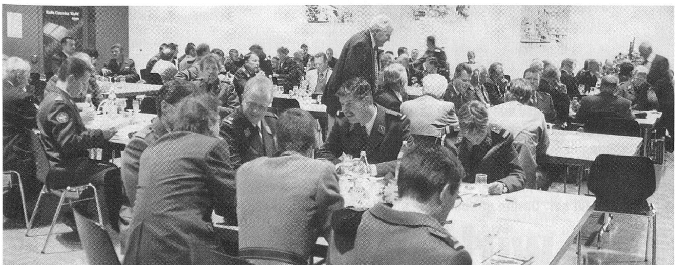
Am vergangenen 27. September wurde im «Kreuz» in Lyss der Grundstein gelegt für die Schweizerische Offiziersgesellschaft der Logistik (SOLOG).

Vorgeschlagen wurde ein Sektionsbeitrag je Mitglied an den Zen-