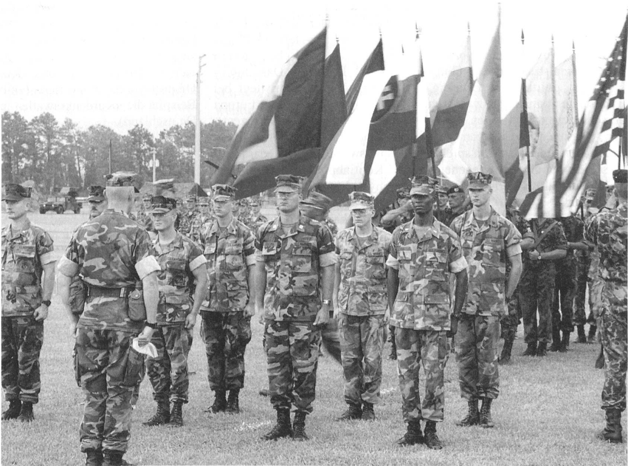
NATO-Partnerschaft für den Frieden - Teil des sicherheitspolitischen Netzwerkes.