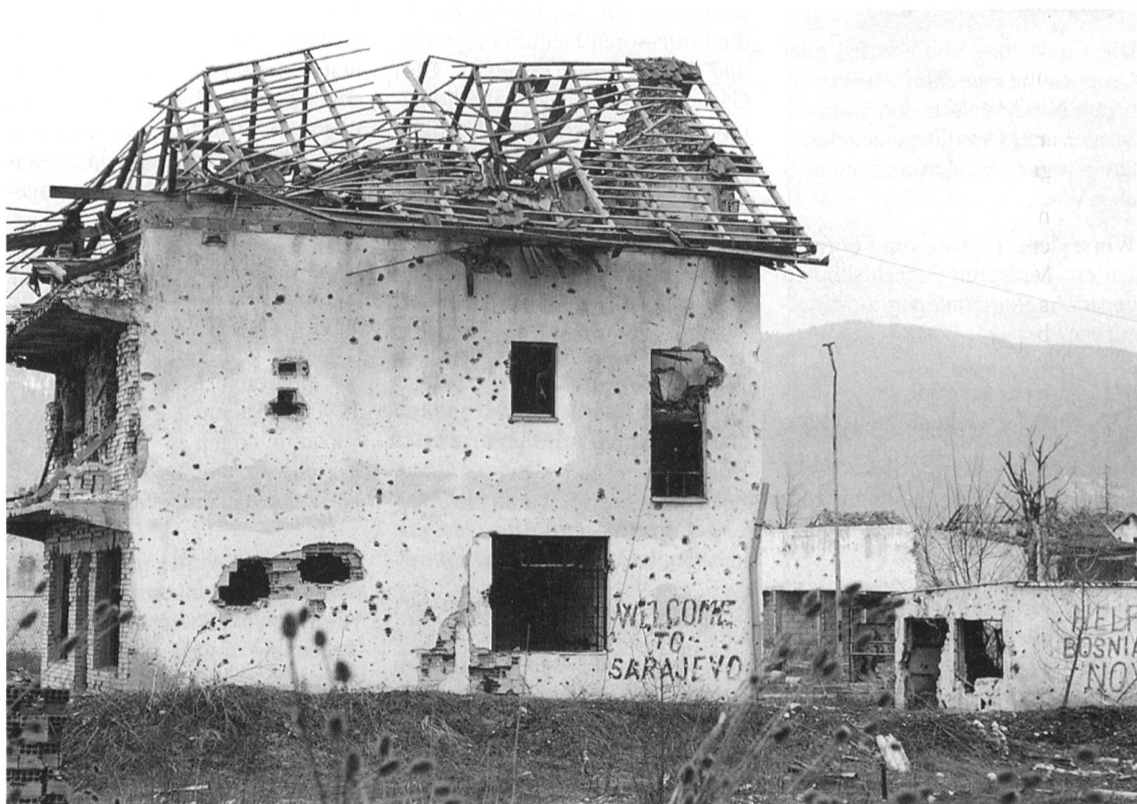
Zerstörungen in der ehemaligen Olympiastadt Sarajewo.

Lokale gewalttätige Auseinandersetzungen oder Kriege aus politischen oder ethnischen Gründen sowie Konflikte im Kampf um Ressourcen (Land, Wasser, Erdöl, Verkehrswege u.a.m.). Die Auswirkungen können insbesondere wirtschaftlicher oder bevölke-