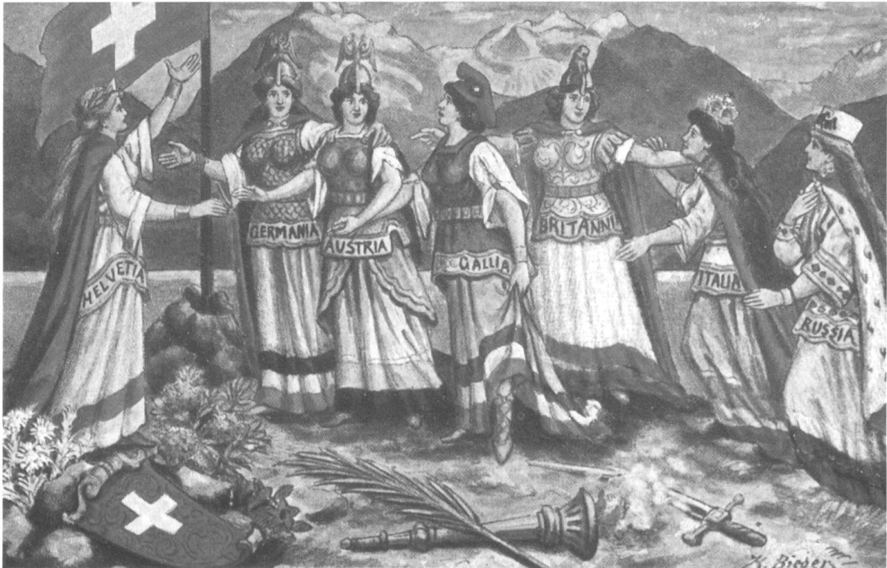
Völkervereinigung. Futur accord des Peuples. Accordo dei Popoli.