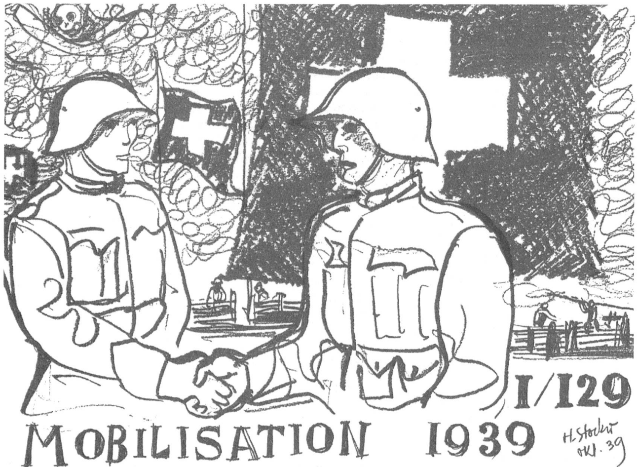
Diese Karte entstand im Oktober 1939. Sie stammt aus der Feder des bekannten Basler Kunstmalers Hans Stocker (1896 bis 1983). Der Erlös kam bedürftigen Kameraden der Ter Füs Kp I/129 zugute.

Der Duce bemerkte, dass in der Schweiz nur die französischen Schweizer zu Frankreich hielten, während die italienischen gegen Italien und die deutschen gegen Deutschland eingestellt seien. Zur Judenfrage sagte der Führer, dass alle Juden nach dem Kriege ganz aus Europa hinaus müssten».