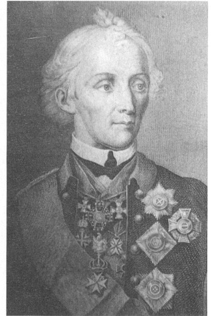
General Alexander Suworow

Zentral war Punkt 1: die Transversalen. 1799 hatte Alexander Suworow die Franzosen ebenso brillant aus Oberitalien wieder hinausgeworfen, wie sie drei Jahre vorher gekommen waren. Gleichzeitig war Erzherzog Karl an die Limmat und bei Zürich darüber hinaus vorgestossen. Doch dann