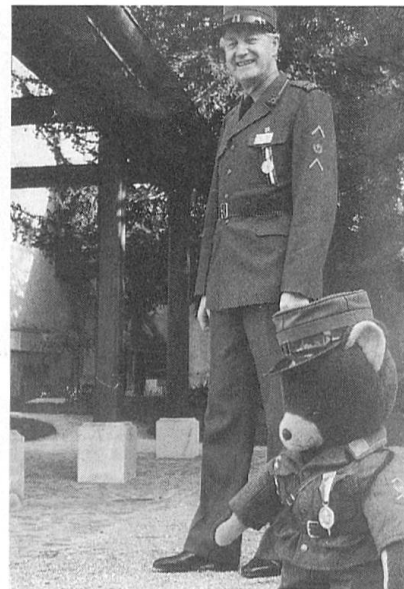
Stolz präsentieren Schütze und Maskottchen ihre Auszeichnung.

Die Schiessstätigkeit der Pistolensektion ist sehr vielfältig und doch nicht überladen. Nebst den Bundesübungen (Bundesprogramm, Obligatorisches Programm und Feldschiessen) können verschiede-