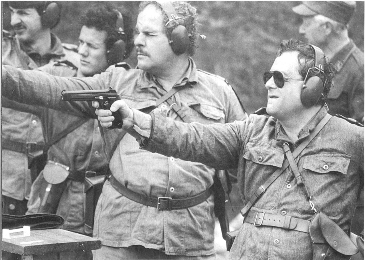
Trotz rückläufiger Teilnehmerzahl existieren in den Sektionen des Schweizerischen Fourierverbandes aktive Pistolenclubs.