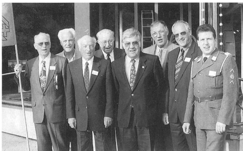
Samstag, 12. April 1997: Acht der zehn OK-Mitglieder stellten sich nach der Delegiertenversammlung des Schweizerischen Fourierverbandes (SFV) in Winterthur dem Fotografen. Und wie das Bild zeigt: Allseits zufriedene Gesichter über den bestens gelungenen Anlass, der den nahezu 200 Delegierten und Gästen bei herrlichem Sonnenschein geboten wurde. Tatsächlich ein Höhepunkt im Jahresprogramm der Sektion Zürich.