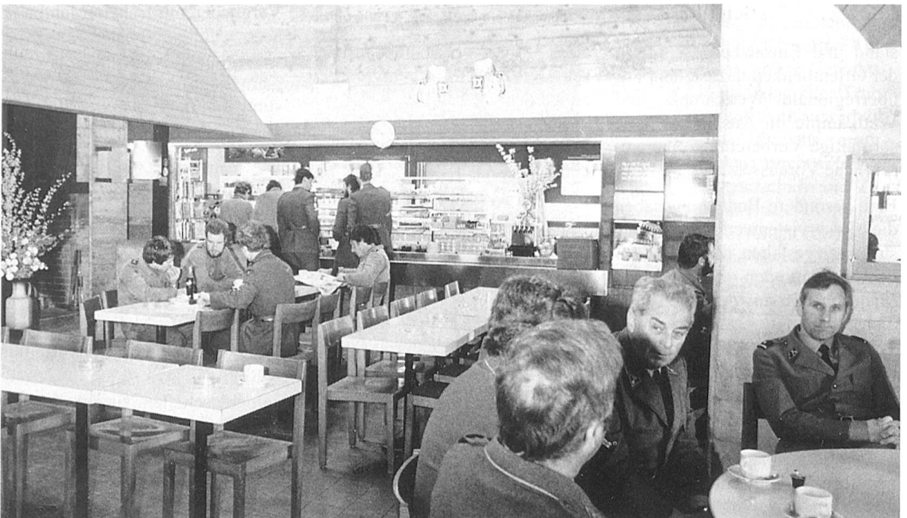
Sowohl ausserdienstlich wie im Militär - der Stammtisch bleibt ein unentbehrlicher Treffpunkt. Unser Bild: Blick gegen den «Stamm» im Café Fohlenweid, die Soldatenstube des Waffenplatzes Bremgarten.