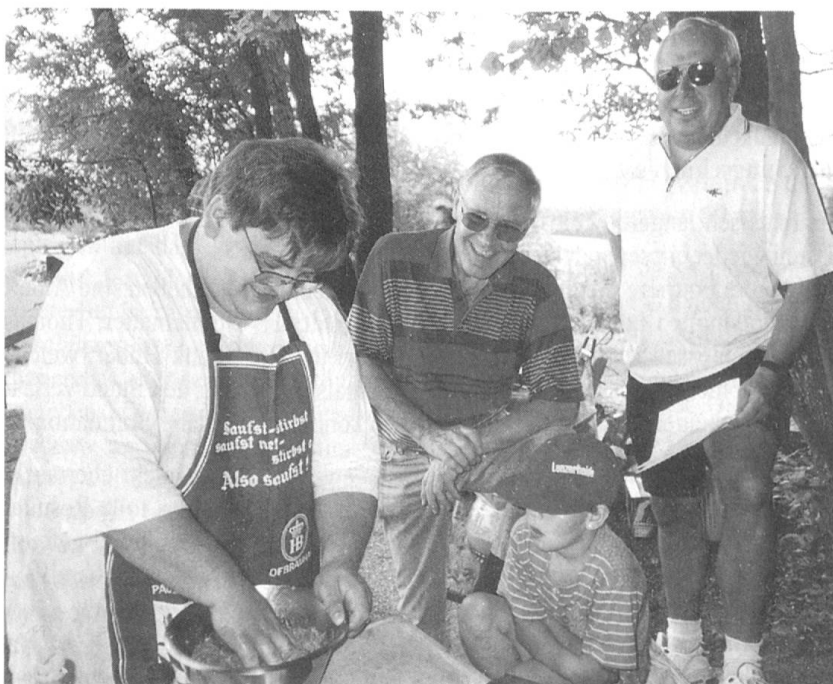
Die Knetkünste des Präsidenten wurden kritisch beobachtet.