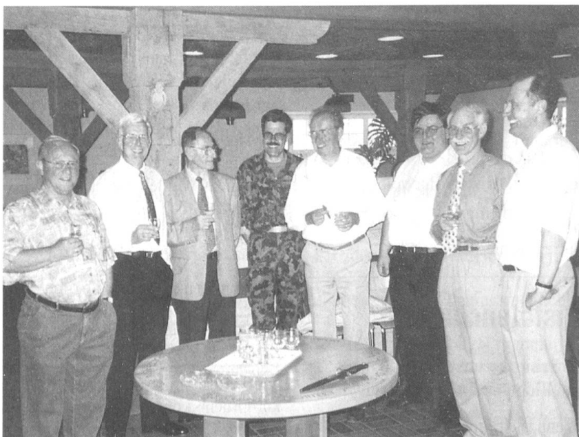
An der Einweihung des neuen Fahnenkastens in der Kantine der Kaserne Aarau.